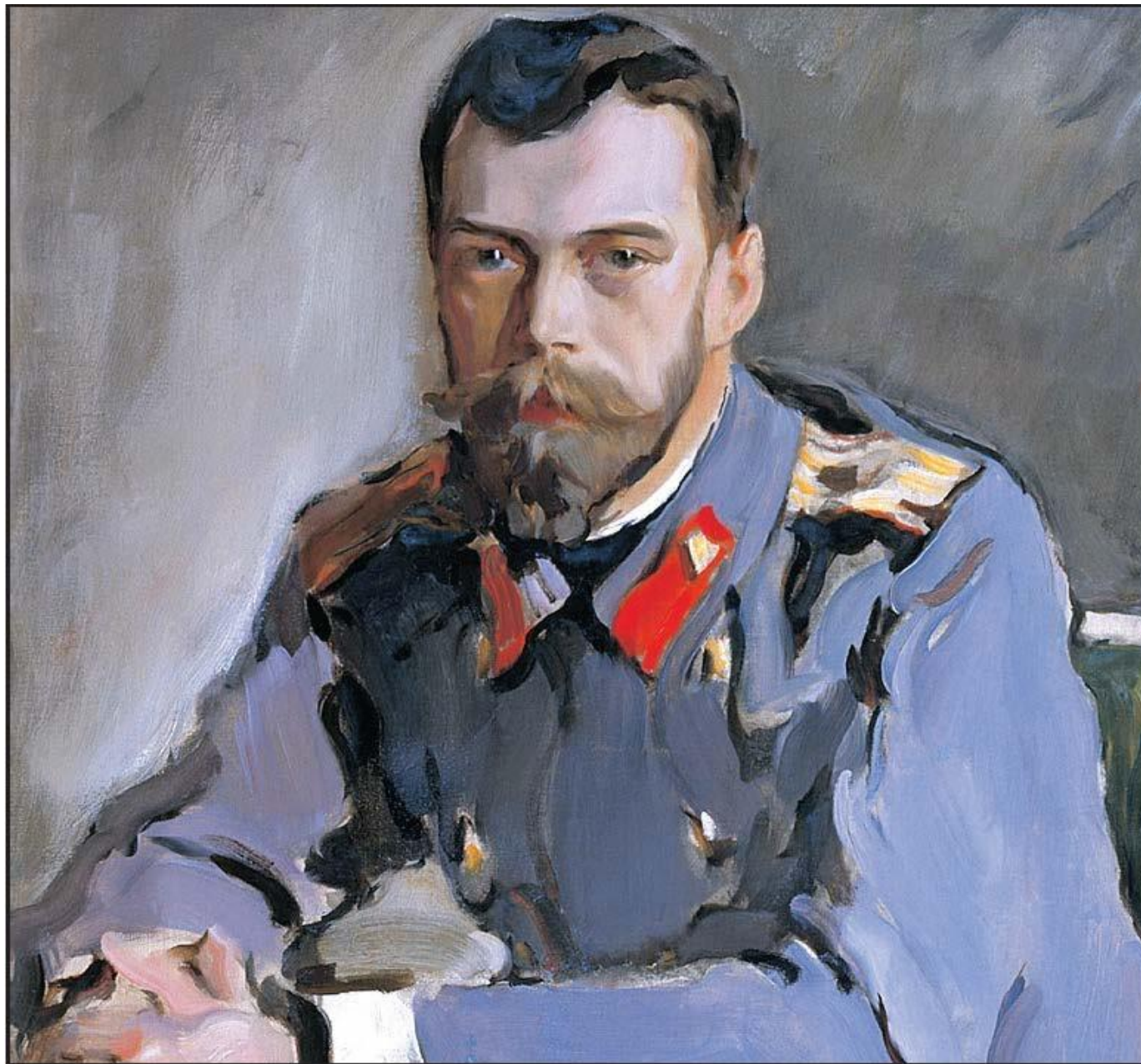
Портрет Николая II. Художник В.А. Серов. 1900 г.