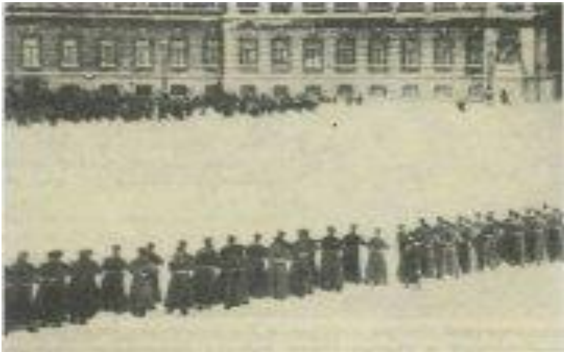
Расстрел рабочих у Зимнего дворца