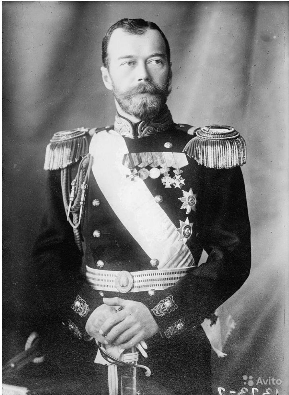
Николай II (1868-1918). Последний российский царь (1894-1917).