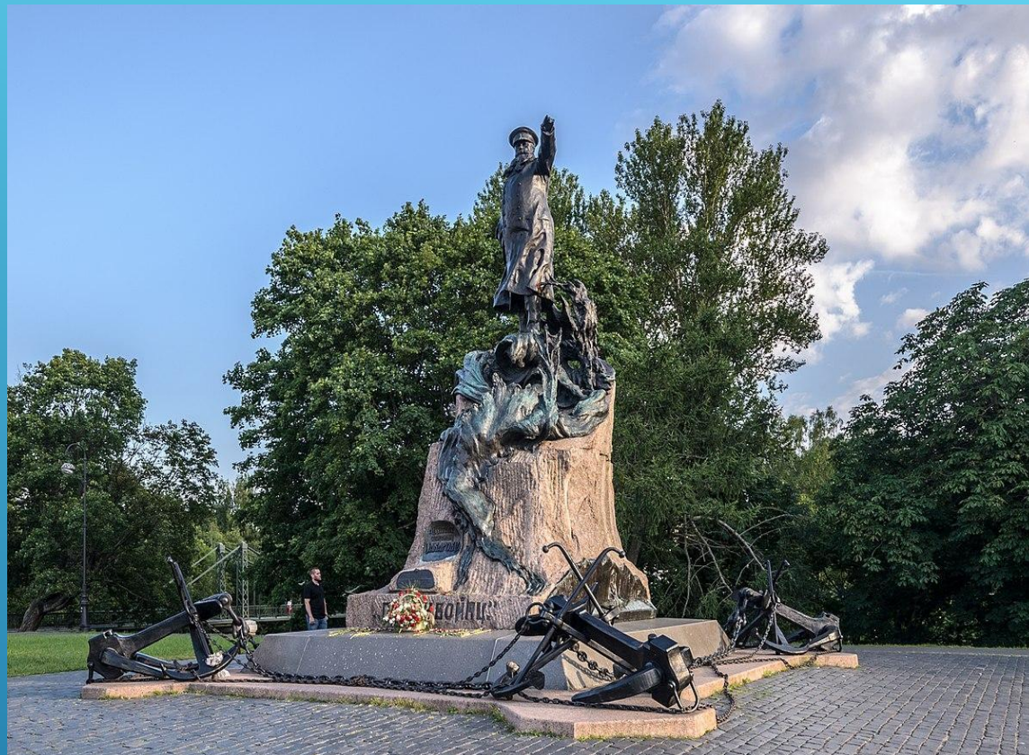
МАКАРОВ СТЕПАН ОСИПОВИЧ (1848—1904)