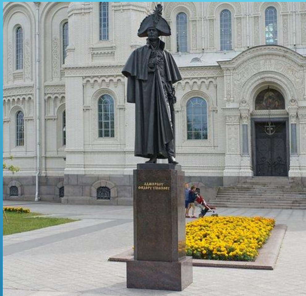
АДМИРАЛ ФЕДОР ФЕДОРОВИЧ УШАКОВ (1745-1817)