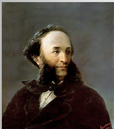
Айвазовский Иван Константинович настоящее имя Ованес Гайвазян, 1817—1900 ) — художник-маринист.