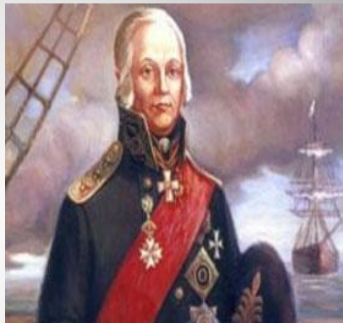
Ушаков Федор Федорович — русский адмирал, командующий Черноморским флотом