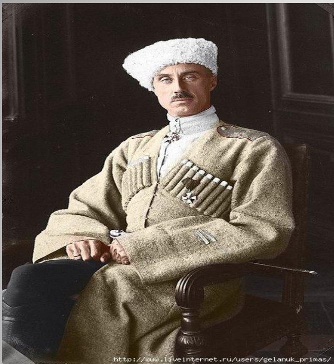
Врангель, Пётр Николаевич — белый барон, командующий Русской Армией в 1920 .