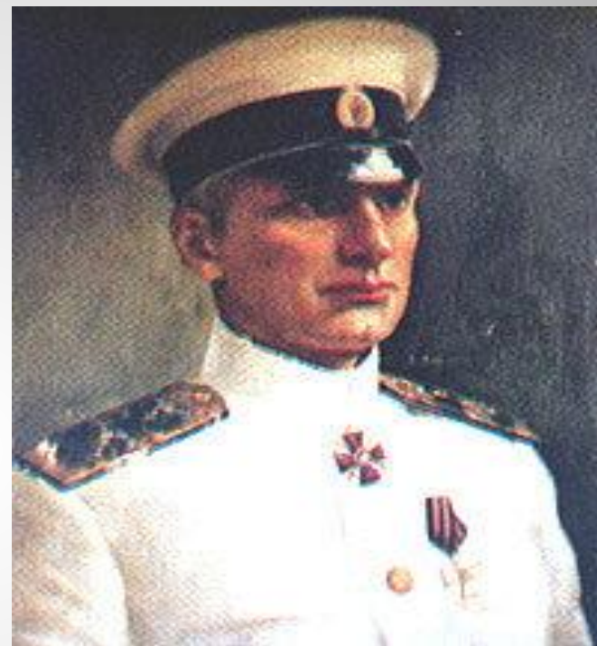
Колчак, Александр Васильевич — русский адмирал, командующий Черноморским флотом . Расстрелян в 1920 в Иркутске .