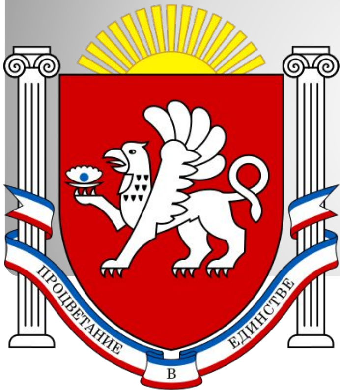
Герб республики Крым