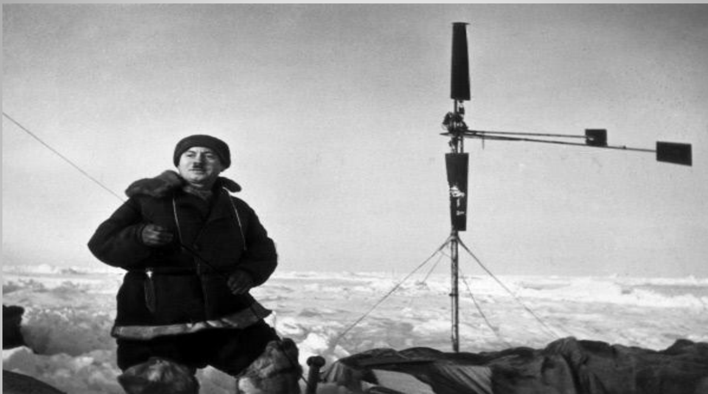
Папанин, Иван Дмитриевич — исследователь Арктики, доктор географических наук, контр-адмирал, дважды Герой Советского Союза