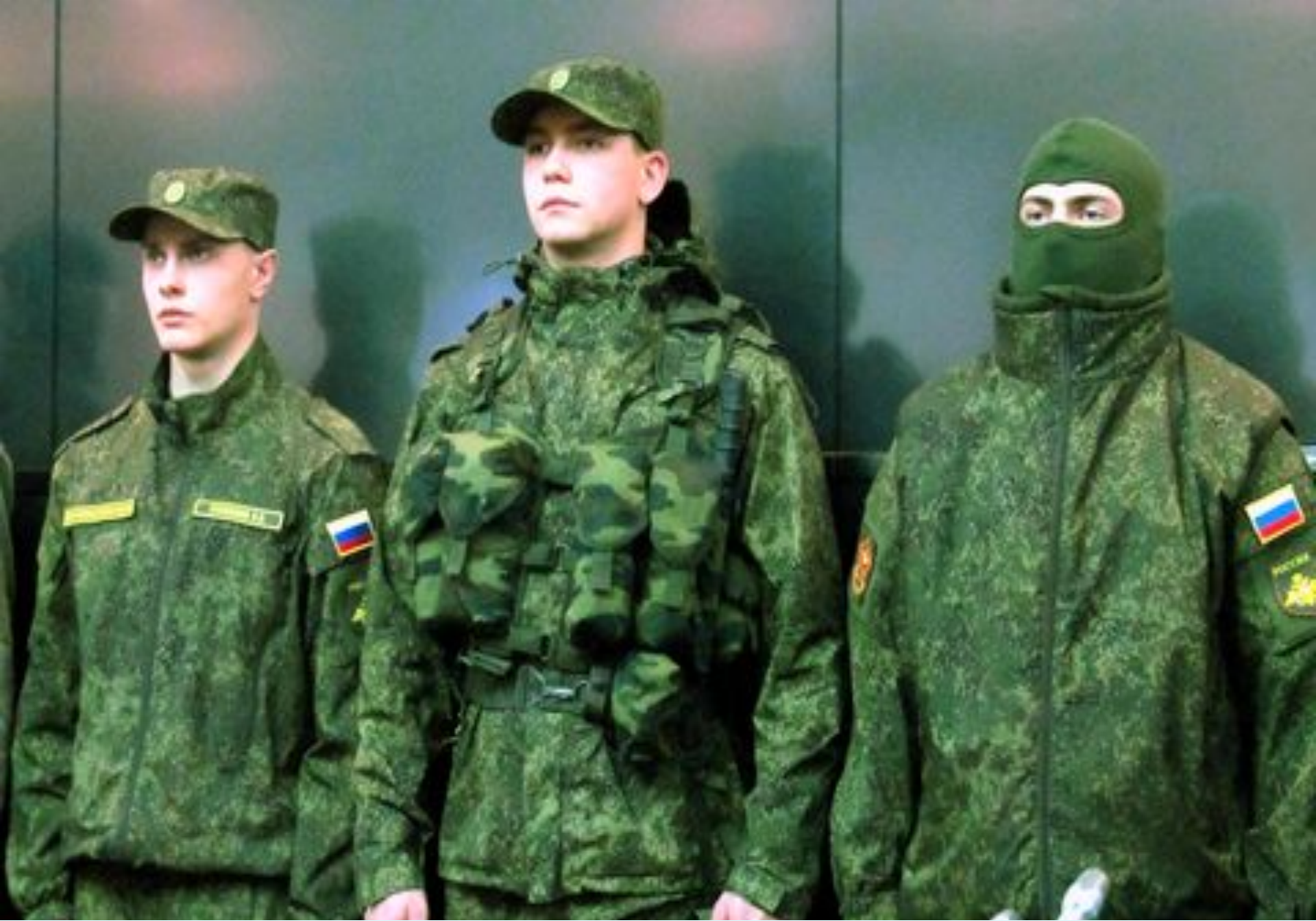
Современная военная форма Российской Армии