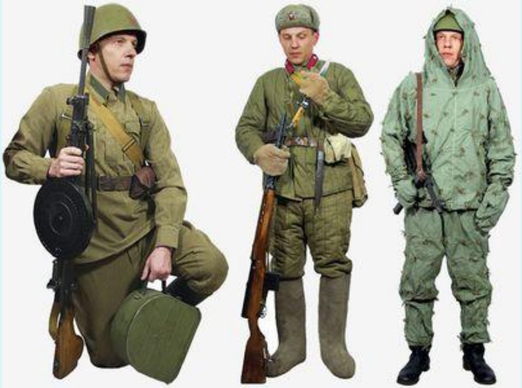
Военная форма Советской Армии в период Великой Отечественной войны