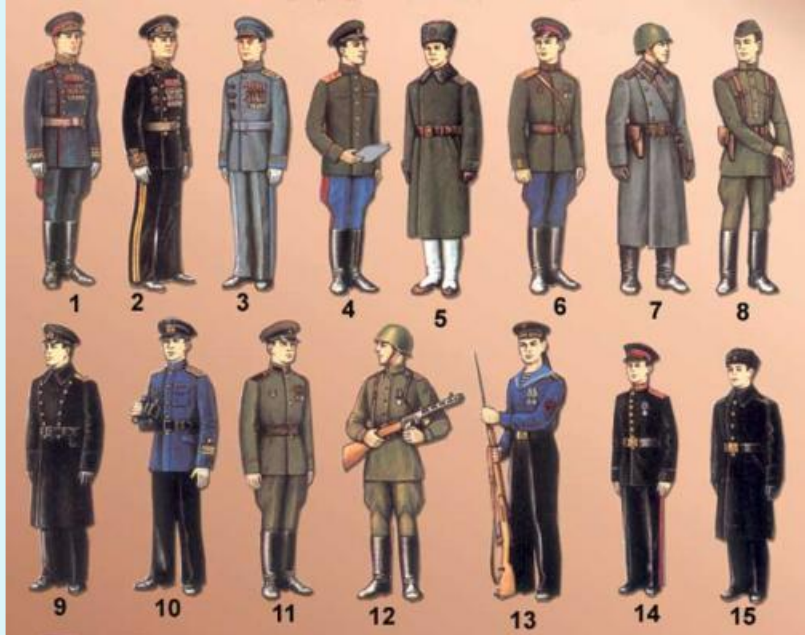
Военная форма Советской Армии до начала Великой Отечественной войны