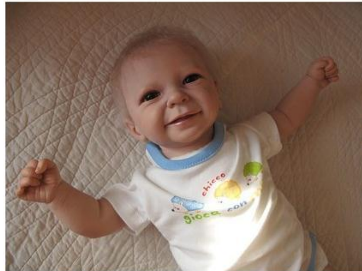
Современная кукла. Материал Винил