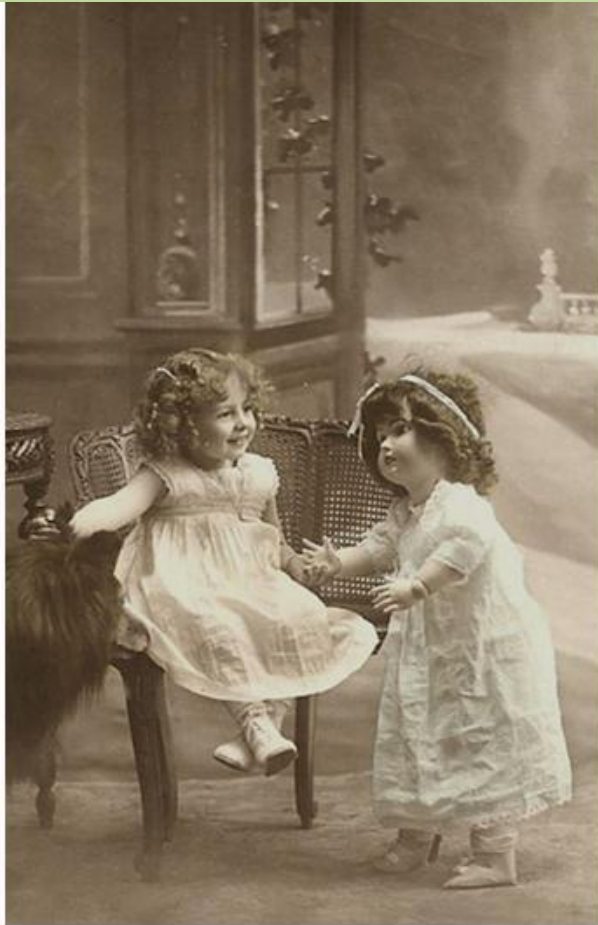
Фотография конца XIX века