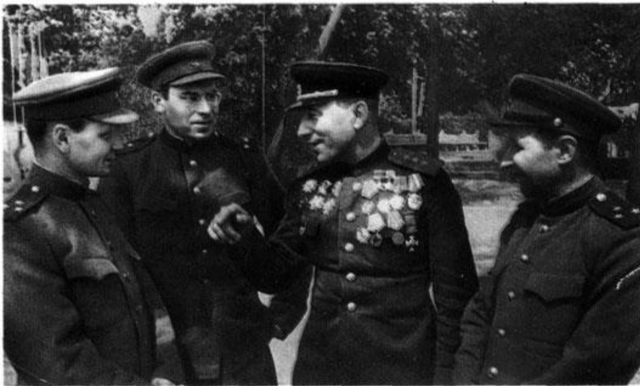
Кукрыниксы в гостях у генерала М. Е. Катюкова под Берлином. 1945 г. Май

Кукрыниксы обыгрывают этот омерзительный парадокс не только как материал для художественных метафор и гипербол, но и как «формулу обвинения», если говорить языком юриспруденции. Они бросают в звериную морду фашизма прокурорский заряд своей сатиры, «облитый горечью и злостью». Они обвиняют фашизм в бесчеловечности. Обвиняют зримо — образы карикатур воспринимаются как вещественные доказательства подлейших преступлений. Фантастическая эксцентриада рисунков, абсолютно далеких от «внешнего правдоподобия», не только не препятствует их жизненной убедительности, но, напротив, является тут ее вернейшим залогом. Есть ли хоть какое-нибудь сходство между обликом больного и вирусом, вызвавшим недуг? А Кукрыниксы показывают именно вирус фашистской эпидемии, обнажают ее скрытую, затаенную суть.