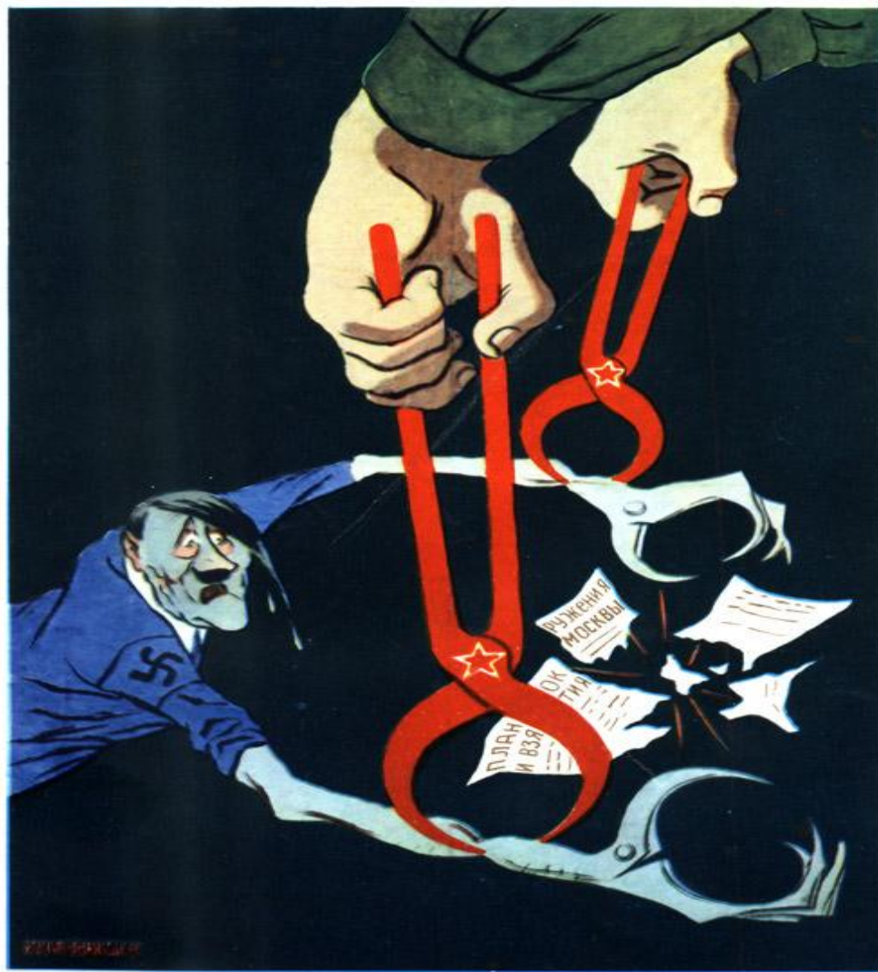
28. Клещи в клещи. 1941