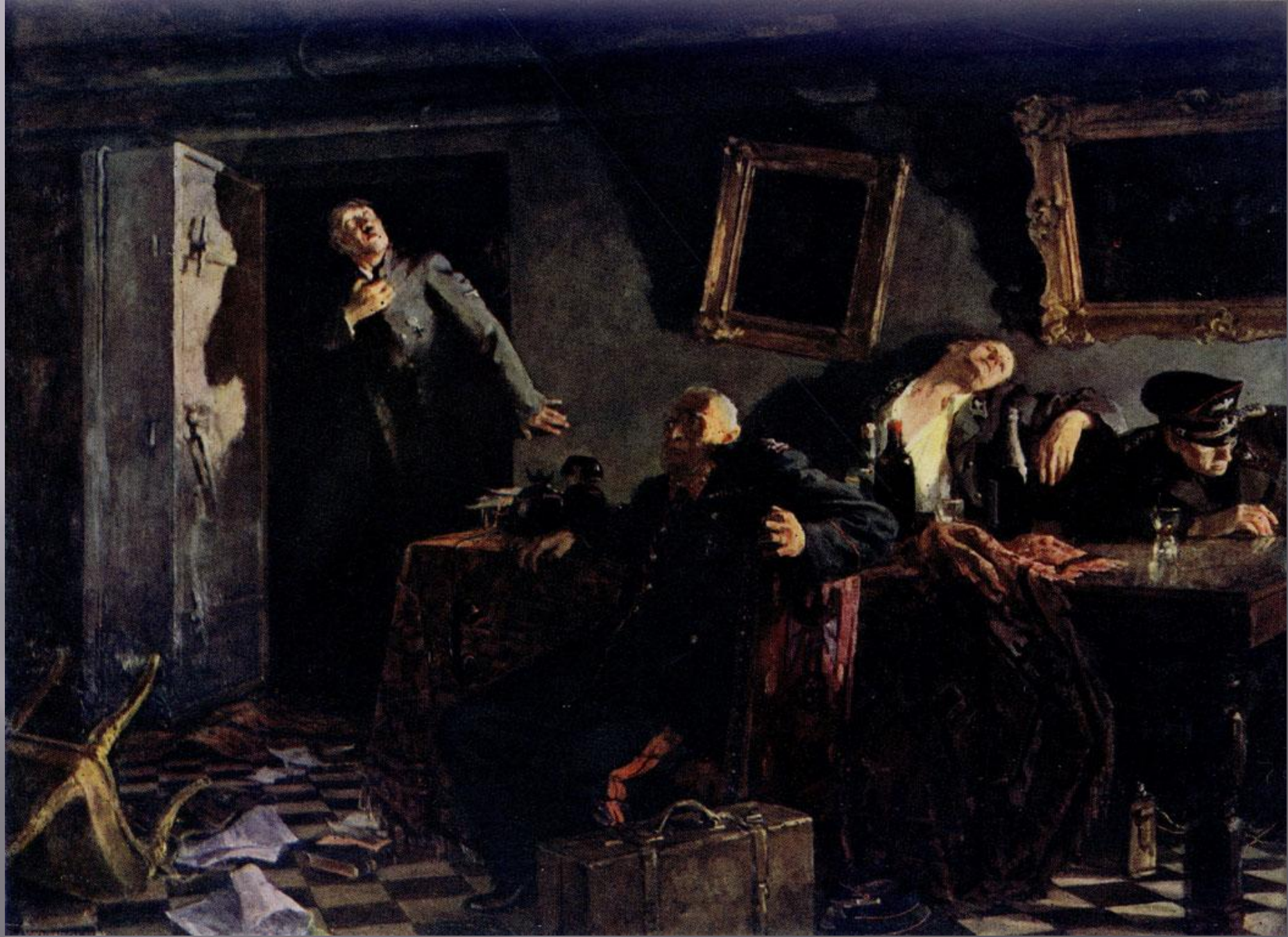
Картина «Конец» 1948г. вершина в живописи Кукрыниксов.