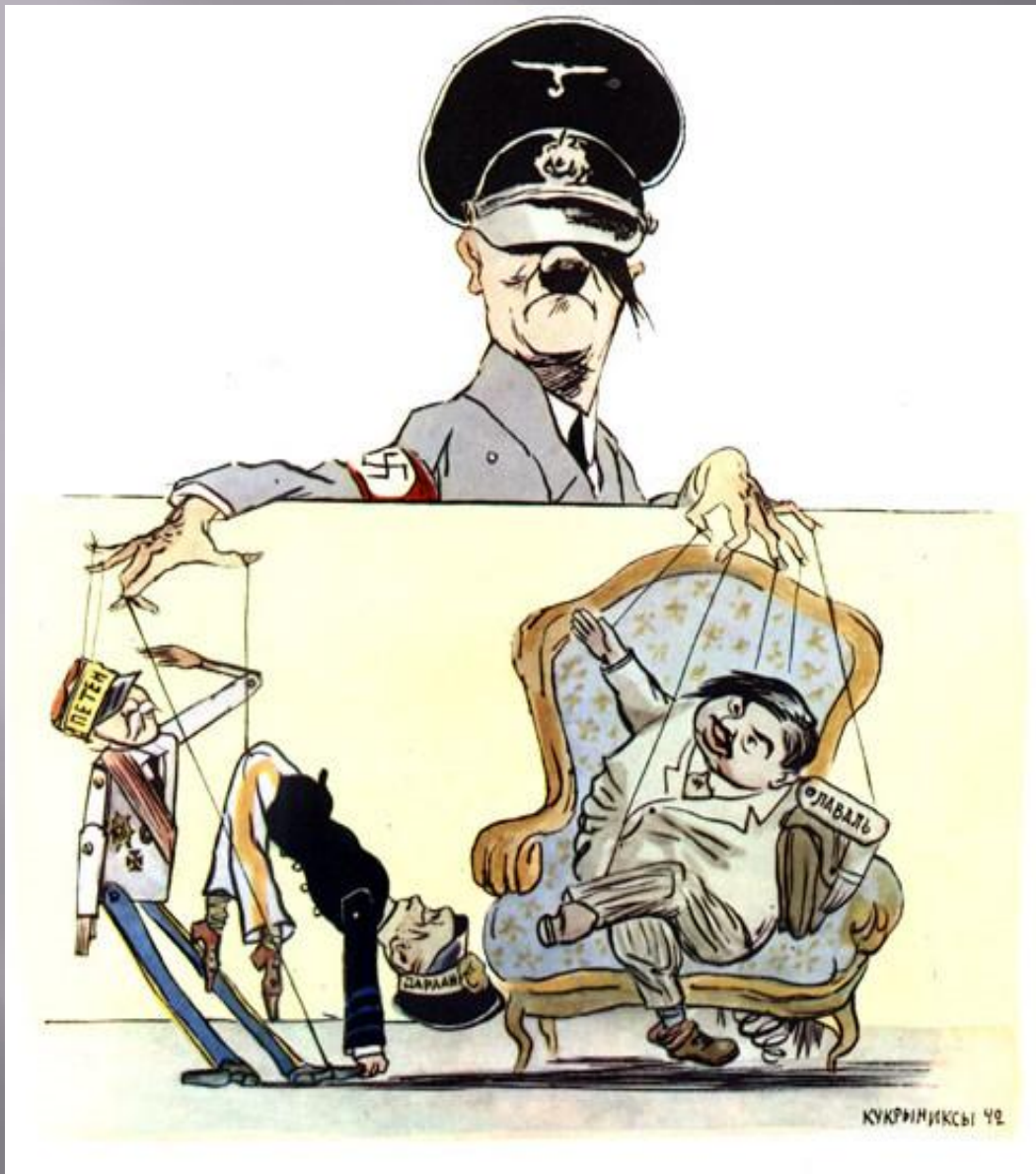
Кукольная кодия в постановке «Театра Виши» 1942

Но вернемся к содержанию военных карикатур Кукрыниксов. Не было ли в них некоторой облегченности, не показывали ли они сильного и беспощадного врага всего лишь жалким и нелепо-смехотворным?