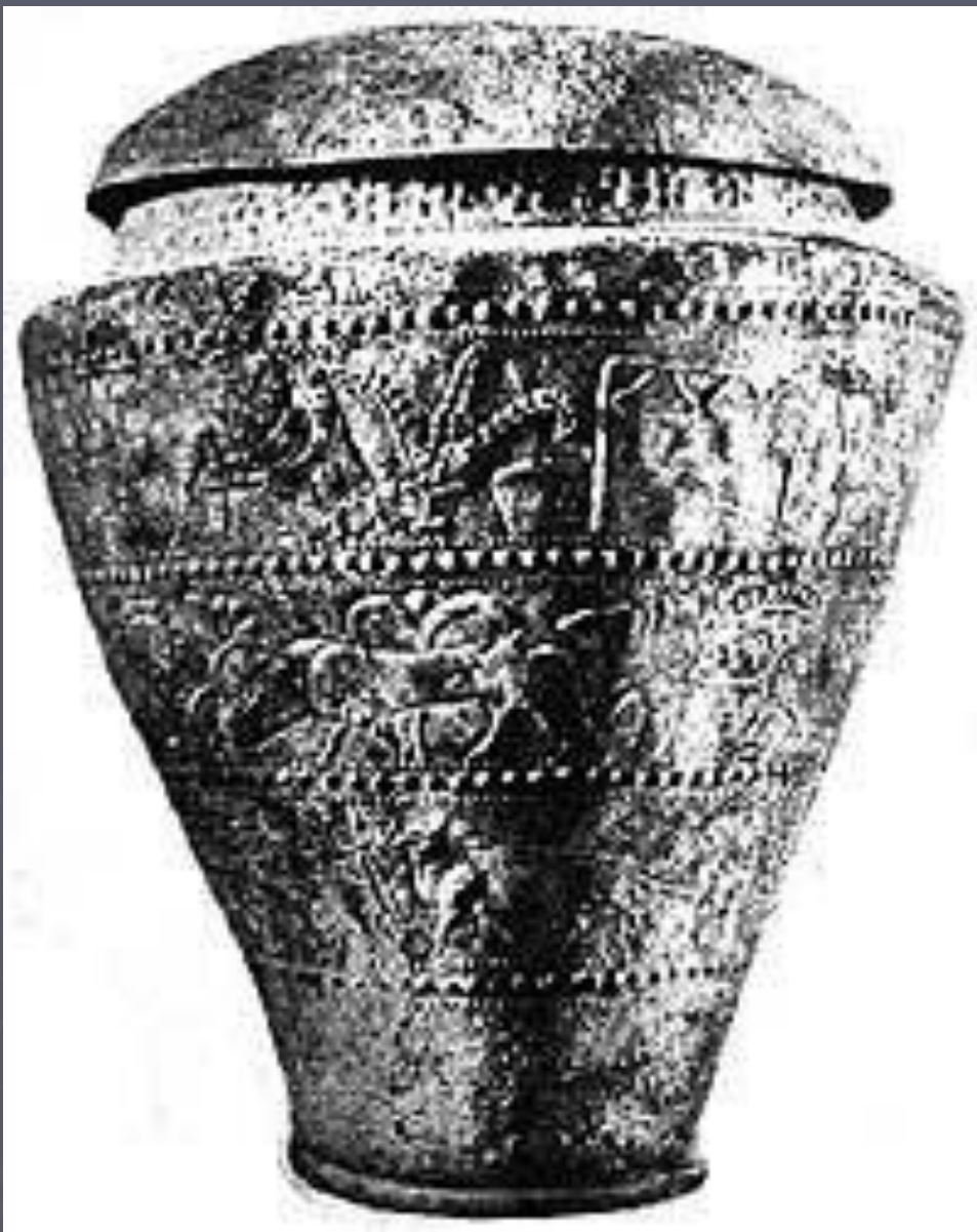
Ситула Бенвенути. VI в. до н.э. (по А.Л. Монгайту 1974, с.154)