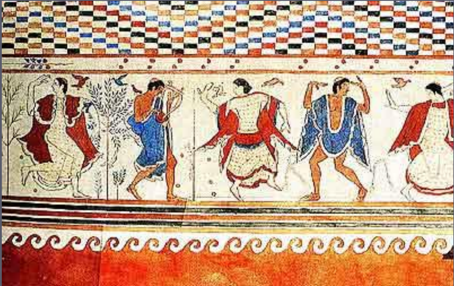
Этрусски. Тарквиния. Томба делла Триклинио.

Этрусски украшали гробницы богатой, яркой настенной росписью – фресками, на которых изображались сцены охоты, спортивные состязания или фестивали, по которым можно судить о жизнерадостном характере этрусков.