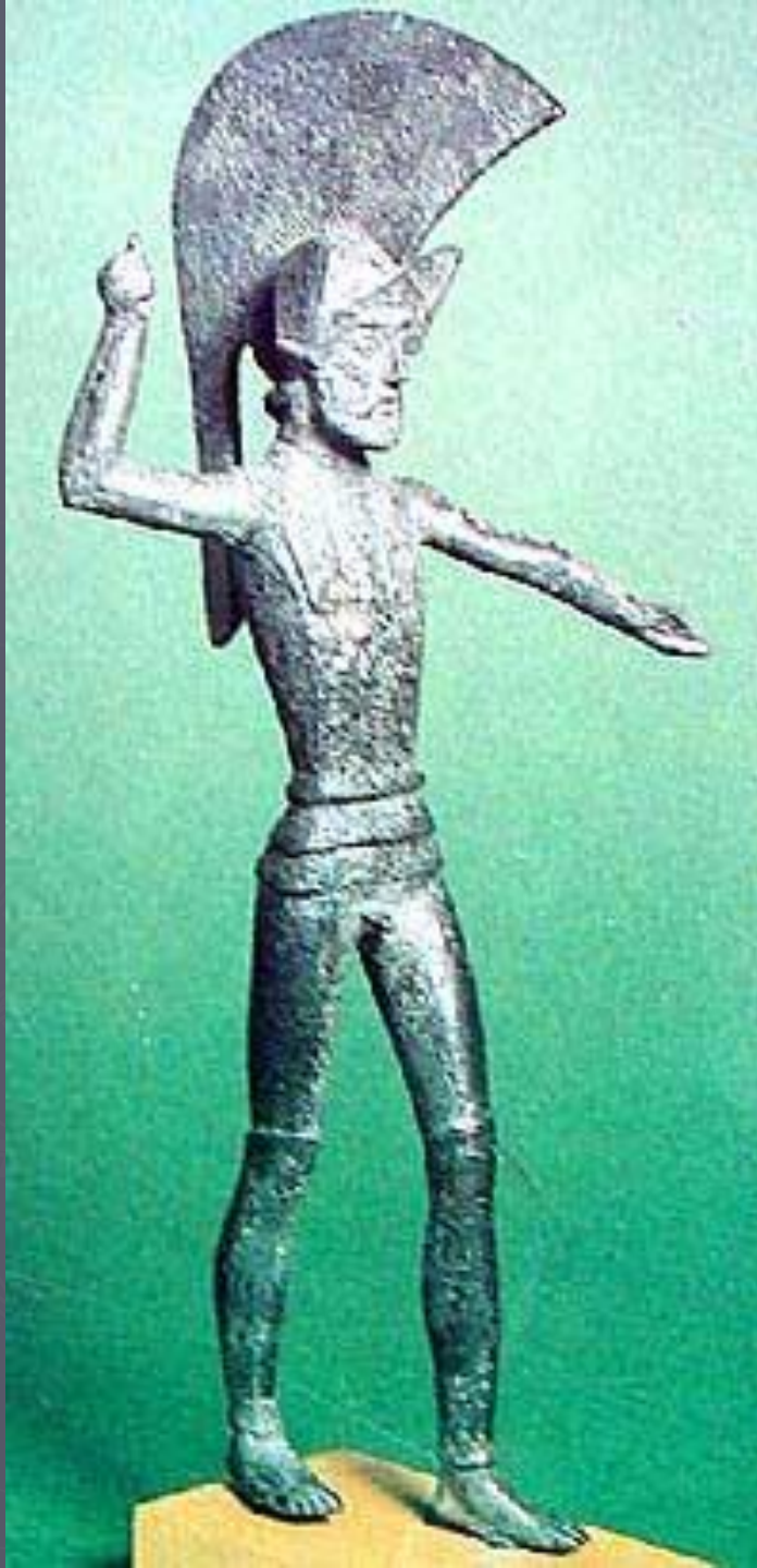
Бронзовая статуэтка этрuscoго воина из Умбрии. Италия. V в. до н.э. Ашмолиан музей. Оксфорд