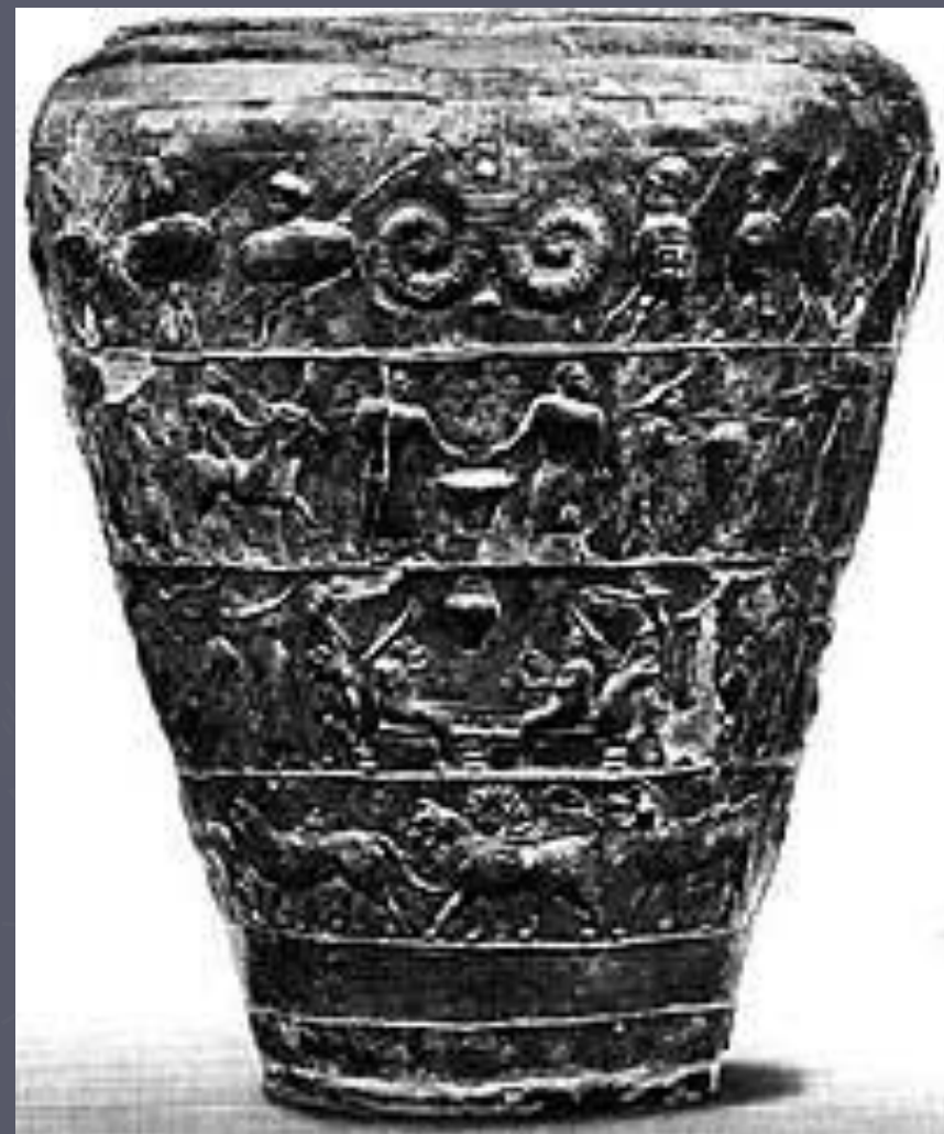
Могильник Чартоза. Ситула. Болонья. Археологический музей

Этруски были отличными граверами. Любили этруски изображать животных, человеческие фигуры и сцены из повседневной жизни. Эти приемы использовались, главным образом для украшения больших бронзовых сосудов-ведер, которые известны под латинским названием "ситула" .