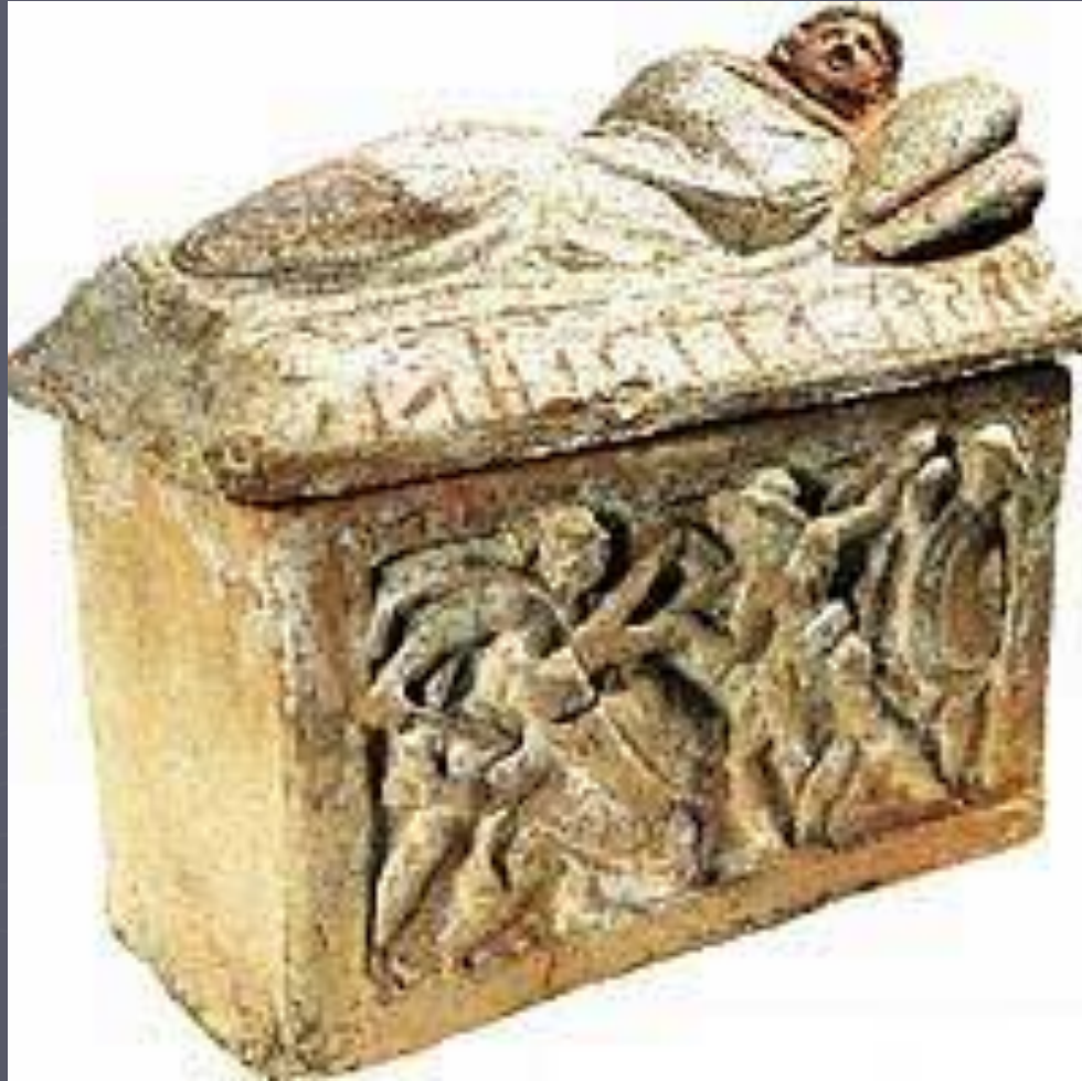
Этруски. Погребальная терракотовая урна. (Steingraber 2000, p.24)

В классический период этруски хоронили не только в гробницах, устроенных в скале или склоне реки, но и в ямах, ставя поверх них надгробные плиты или скульптуры .