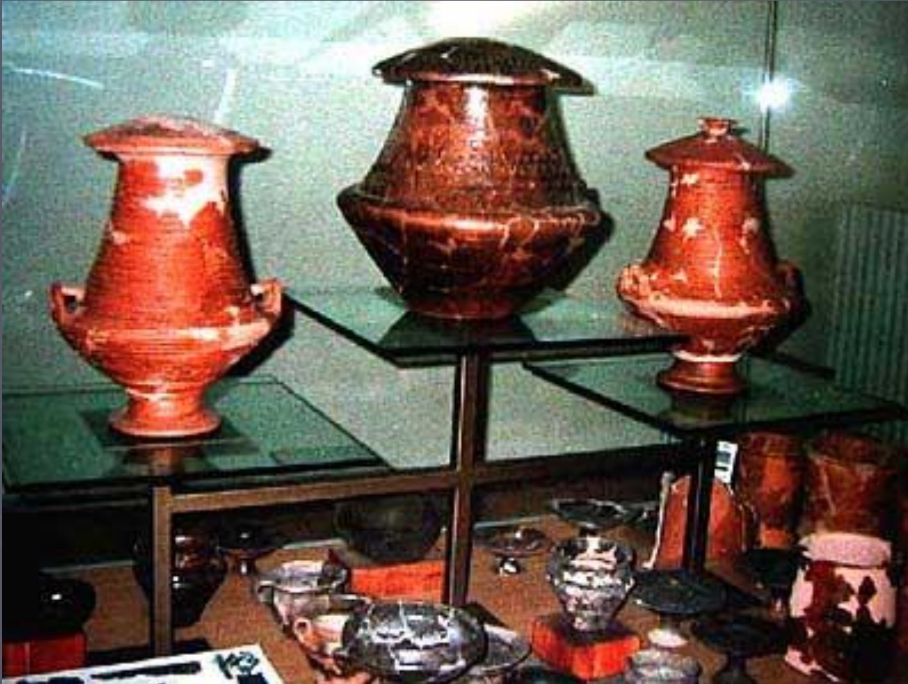
Керамика Марцаботто. Археологический музей

Наиболее ярким видом искусства, связанным с идеей загробной жизни, стали каноны – глиняные сосуды с крышкой для хранения праха усопших.