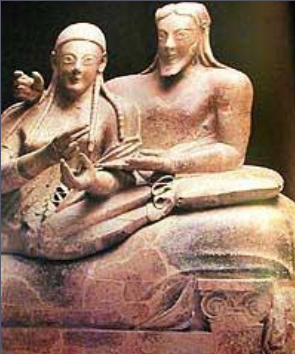
Этруски. Надгробие саркофага. Черветери.

Широко известно искусство этрусских саркофагов , которые украшались скульптурными изображениями умерших.