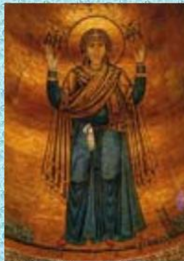
Богородица Оранта (собор св. Софии Киевской)