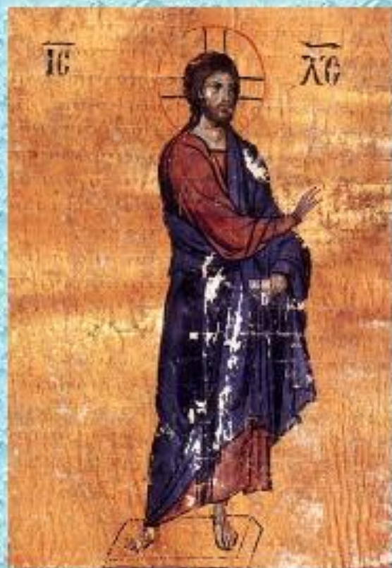
Христос Вседержитель (собор св. Софии Киевской)