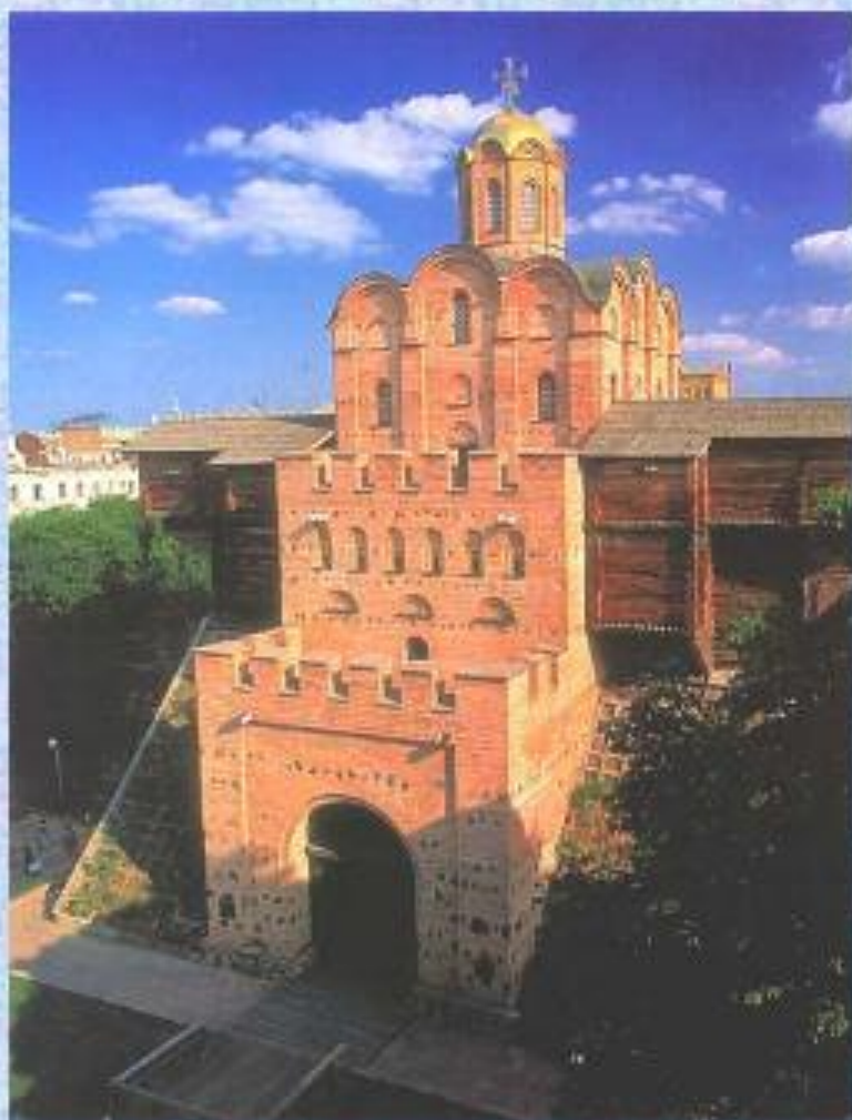
Золотые ворота в Киеве