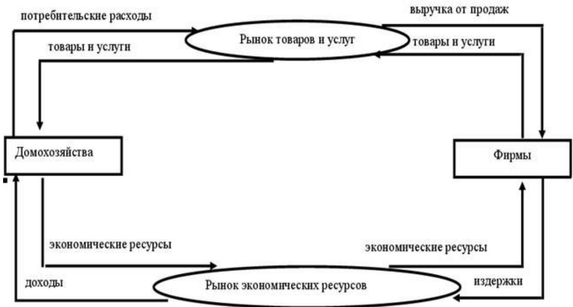
Диаграмма кругооборота потоков в экономике