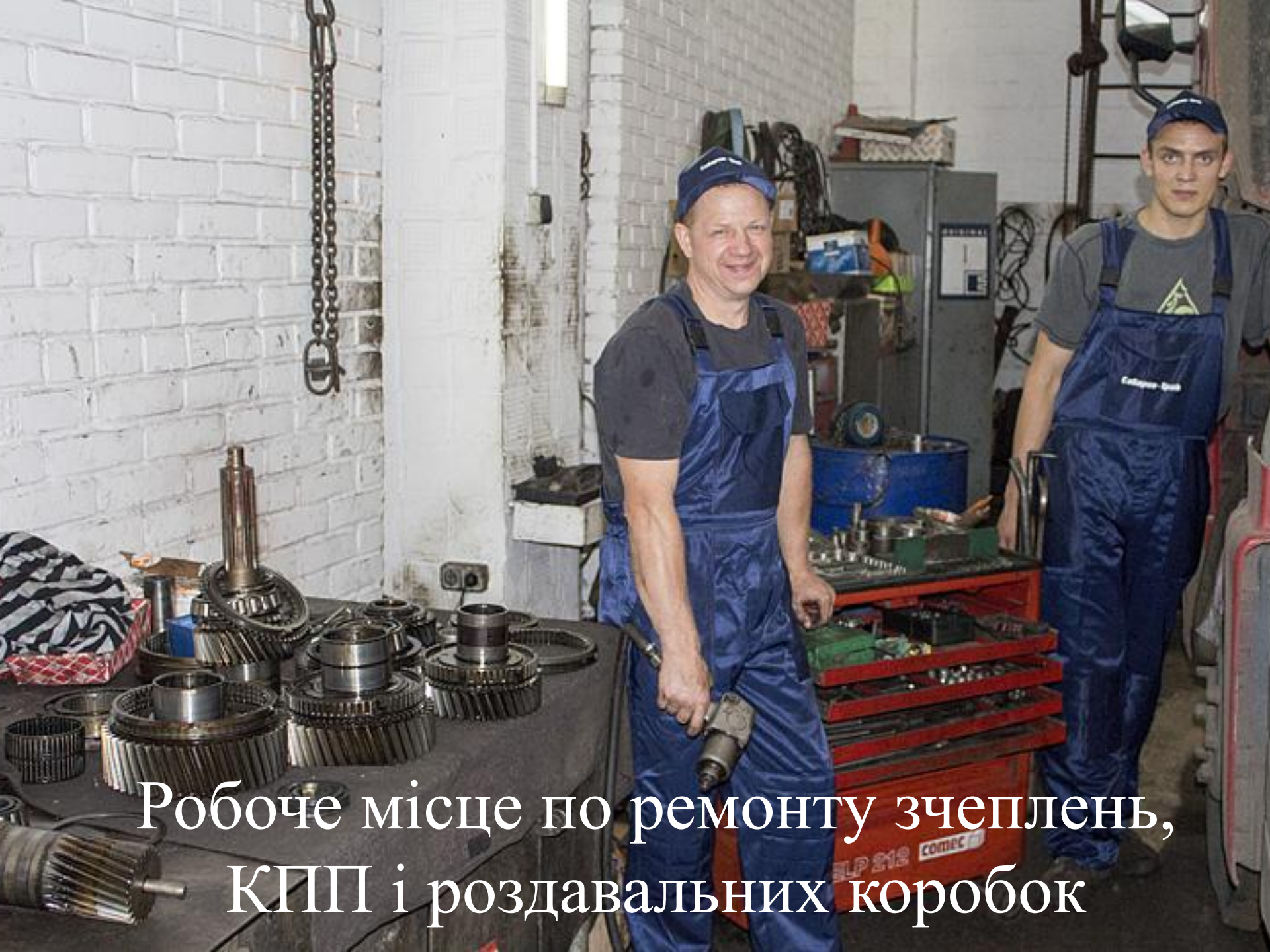
Робоче місце по ремонту зчеплень, КПП і роздавальних коробок