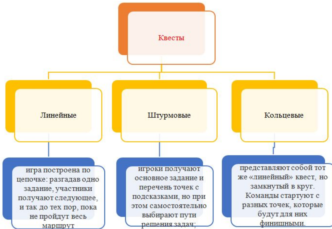
Рисунок 4. Виды квестов