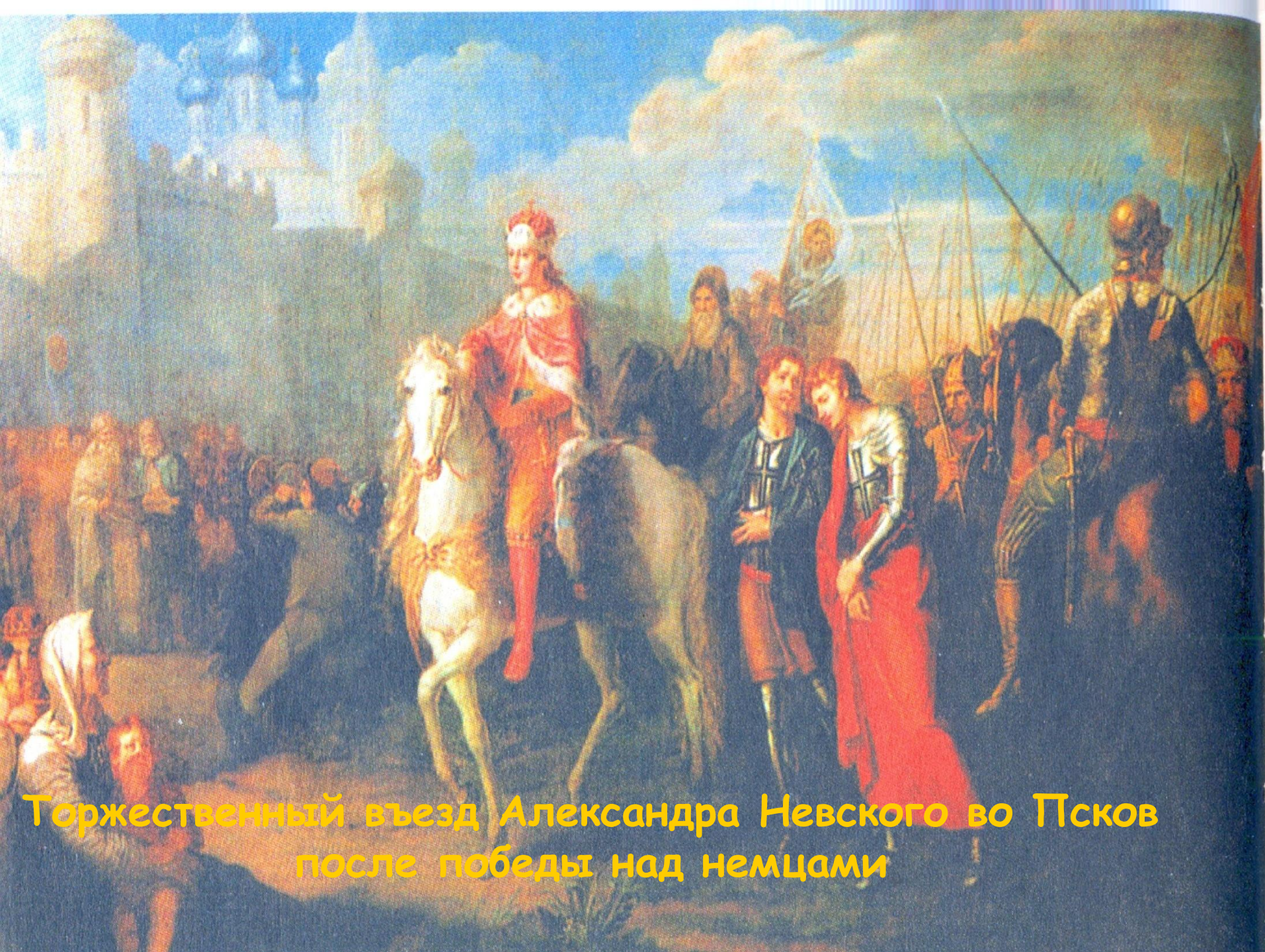
Торжественный въезд Александра Невского во Псков после победы над немцами