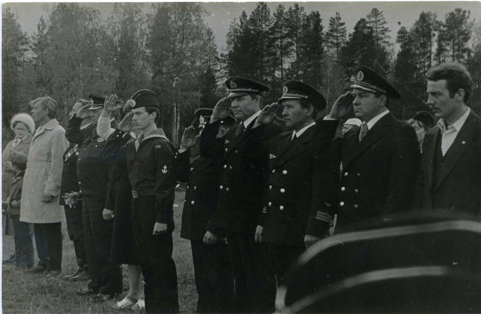
На линейке в честь открытия смены.