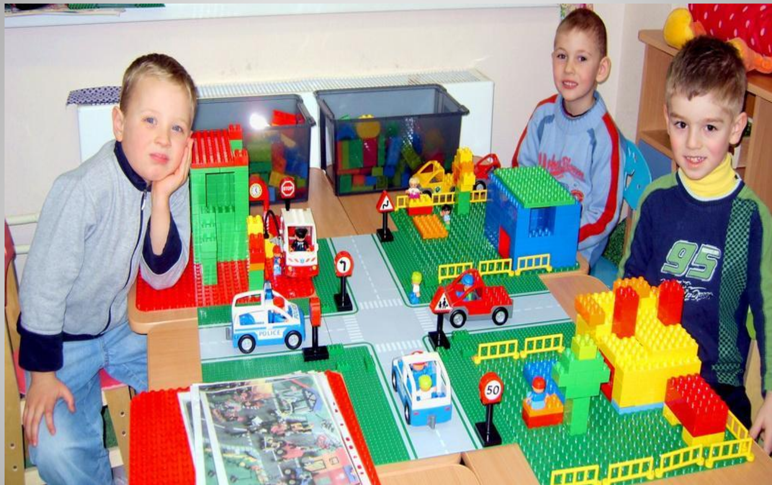
Третья часть - обыгрывание построек.