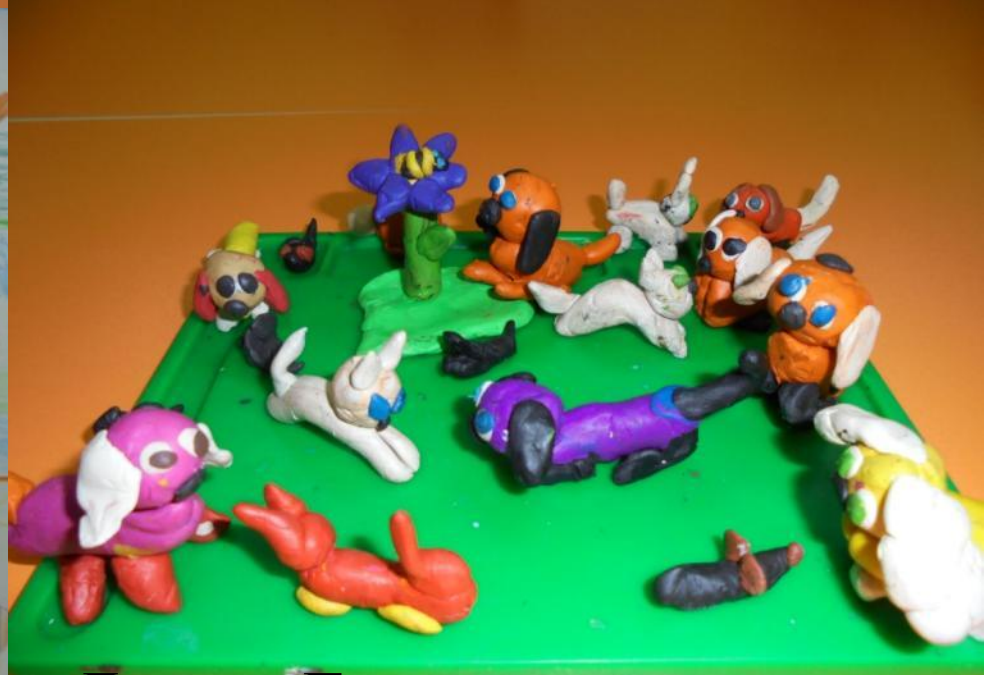
Лепка «Герои сказки»