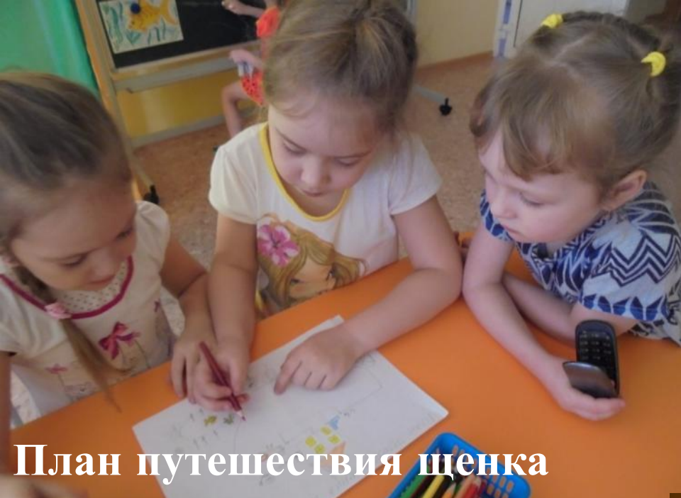
План путешествия щенка