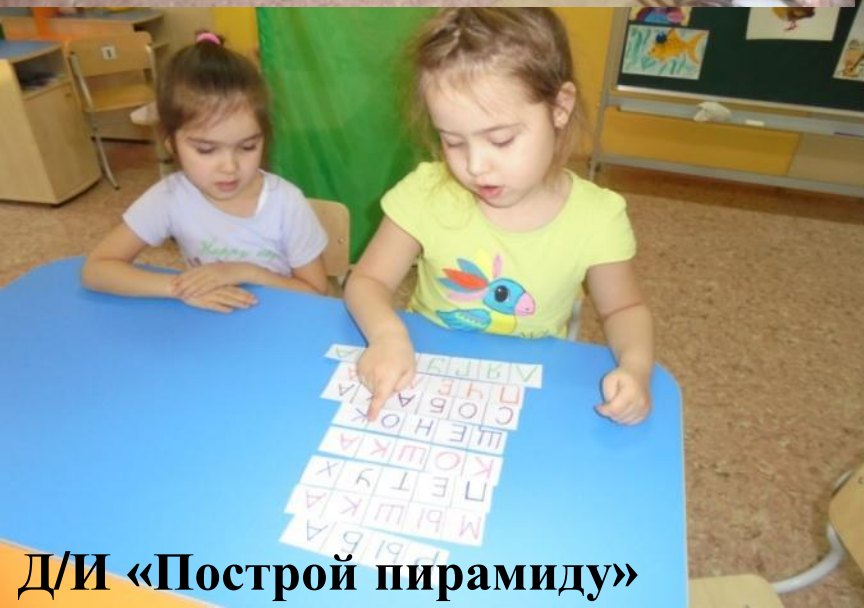
Д/И «Построй пирамиду»