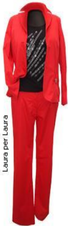
Laura per Laura