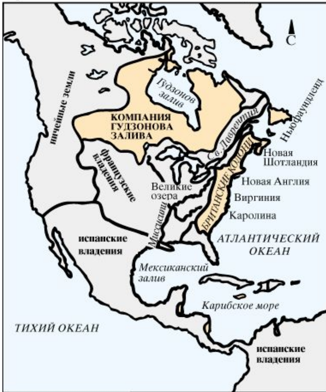
Британские владения в Новом Свете, 1713

1880-1890-е гг. – монополизация промышленности