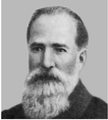
Каптерев Петр Федорович

«Высшая цель воспитания указывается в воспитании нравственном, в воспитании нравственного характера, все же прочее должно подчиняться этой наивысшей цели».