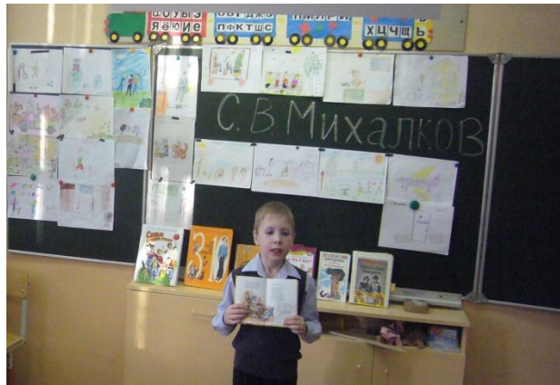
Юбилейные чтения «Сергей Михалков - детям»