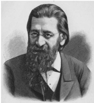
Стоюнин Владимир Яковлевич

«Школа должна приготовить духовные силы юноши для создания идеала, должна пробудить в нем бескорыстную любовь к истине, правде, добру и прекрасному, и стремления к ним...»