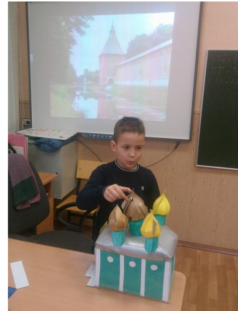
Классный час «Люблю тебя, мой город!»