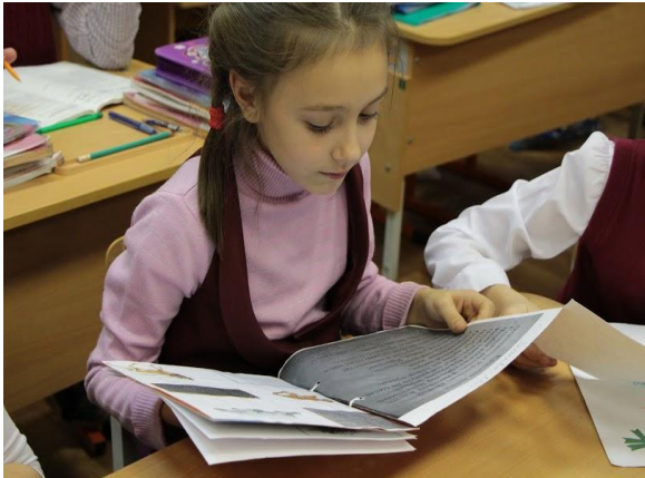
Проект «Памятники Смоленска»