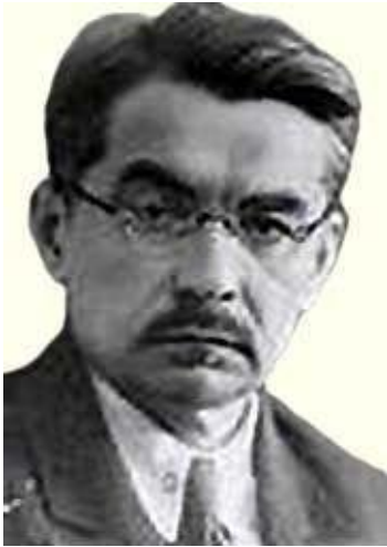
Поливанов Лев Иванович

«Существует две системы обучения и воспитания. Первая – воспитание человека народного – «ответственного деятеля практической среды», вторая – система обучения интеллигента-космополита, умеющего мыслить глобально».