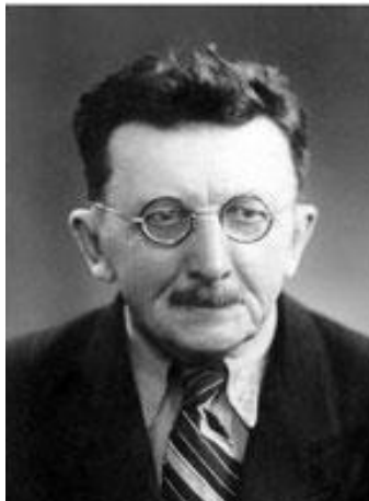
Сорока-Росинский Виктор Николаевич

«Воспитание превращается в долг каждого – и для воспитывающего, и для воспитываемого, в нравственную обязанность перед народом, Родиной, Богом».