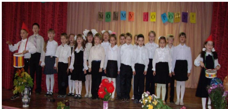
Фестиваль творчества «Моему городу»