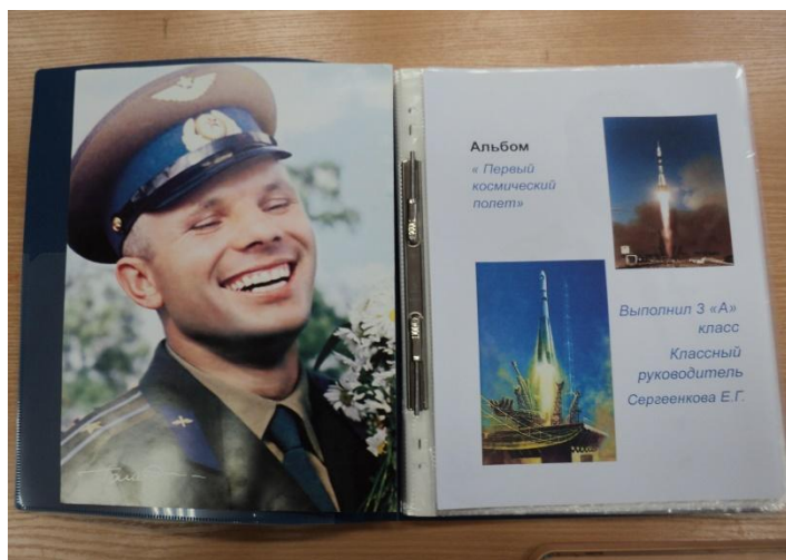
Проект «Мои знаменитые земляки»