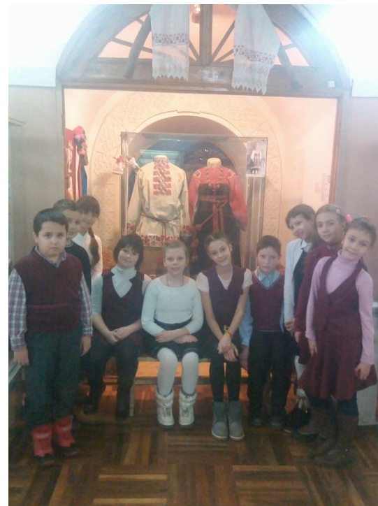
В музее «Смоленский лен»