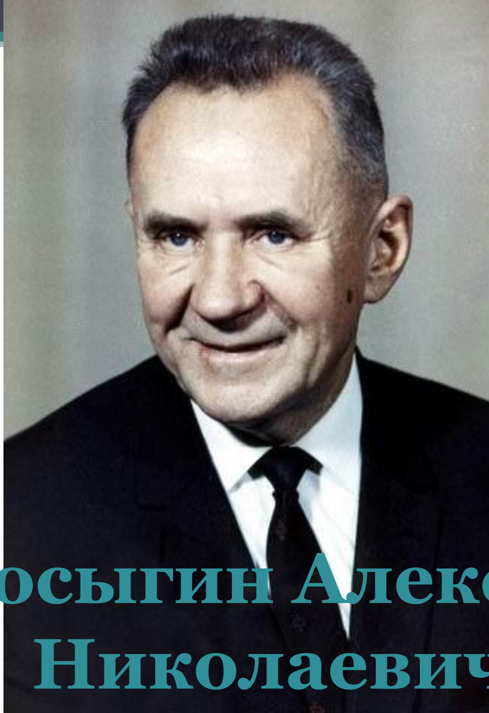
Косыгин Алексей Николаевич