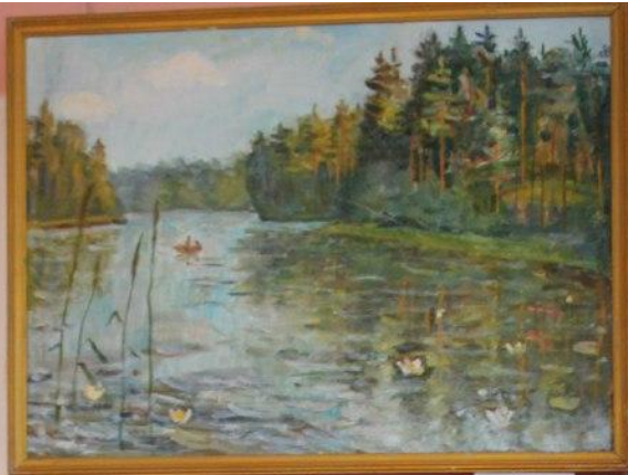
«Лесная река» 1978 г.