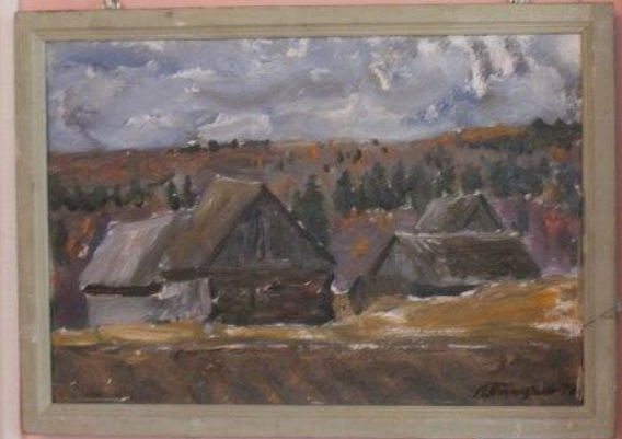
«Восход» 1977 г.