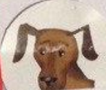
Схема рассказа о животных