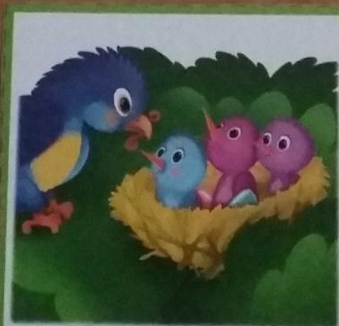
Она накормила птенцов