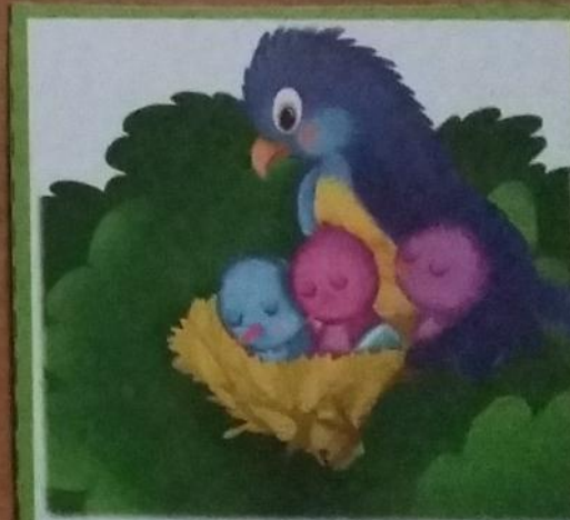
Птенцы поели и уснули