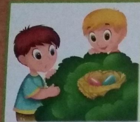
Ребята нашли в кустах гнездо