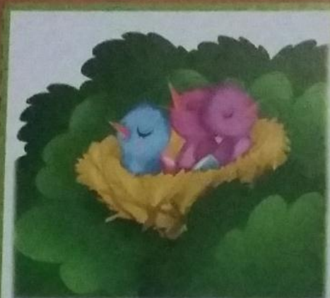
В гнезде были птенцы