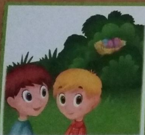
Мальчики тихо отошли от гнезда