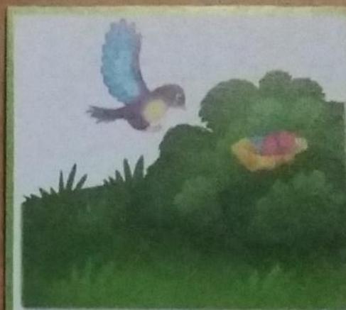
Скоро к гнезду прилетела мать