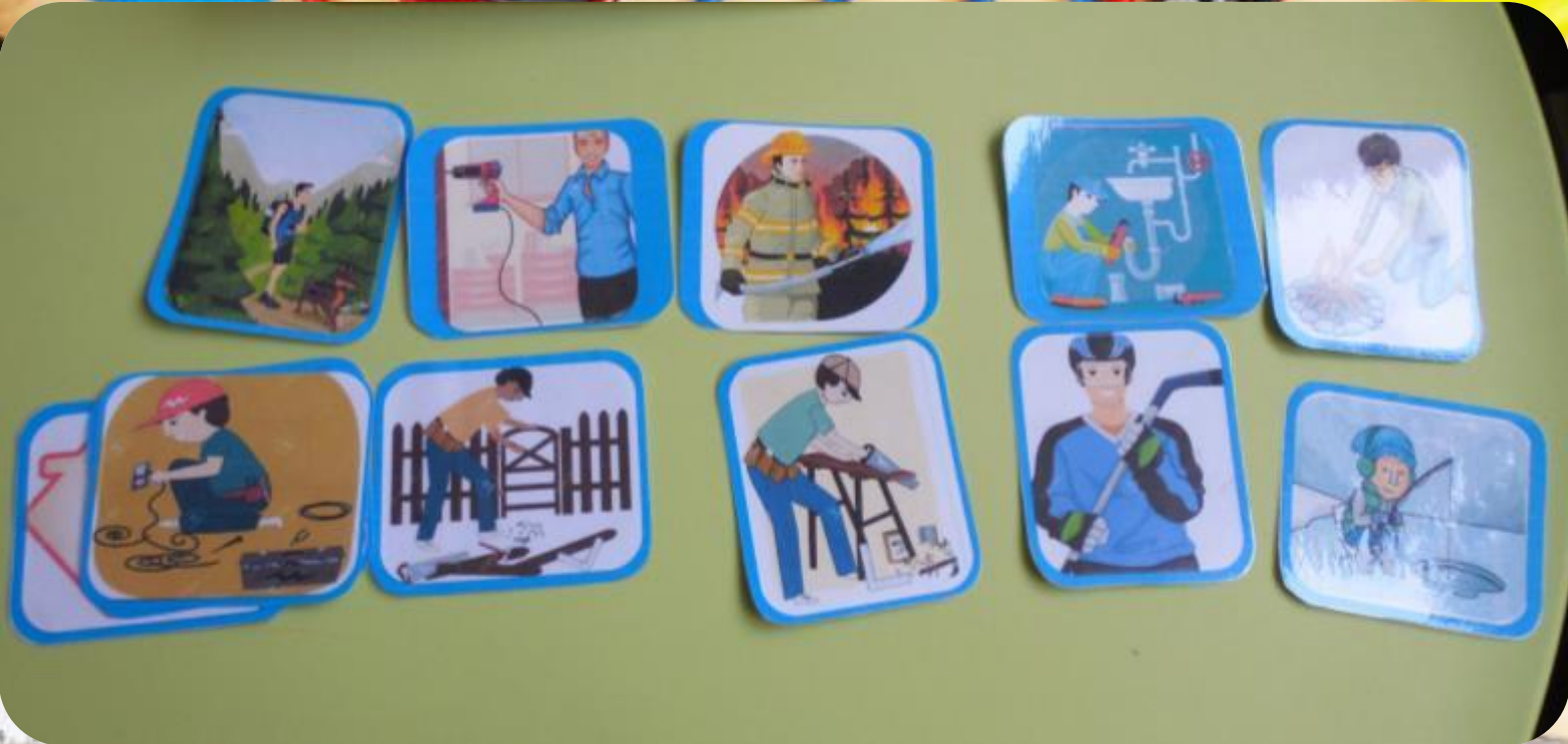
Карточки «Что умеет делать папа»