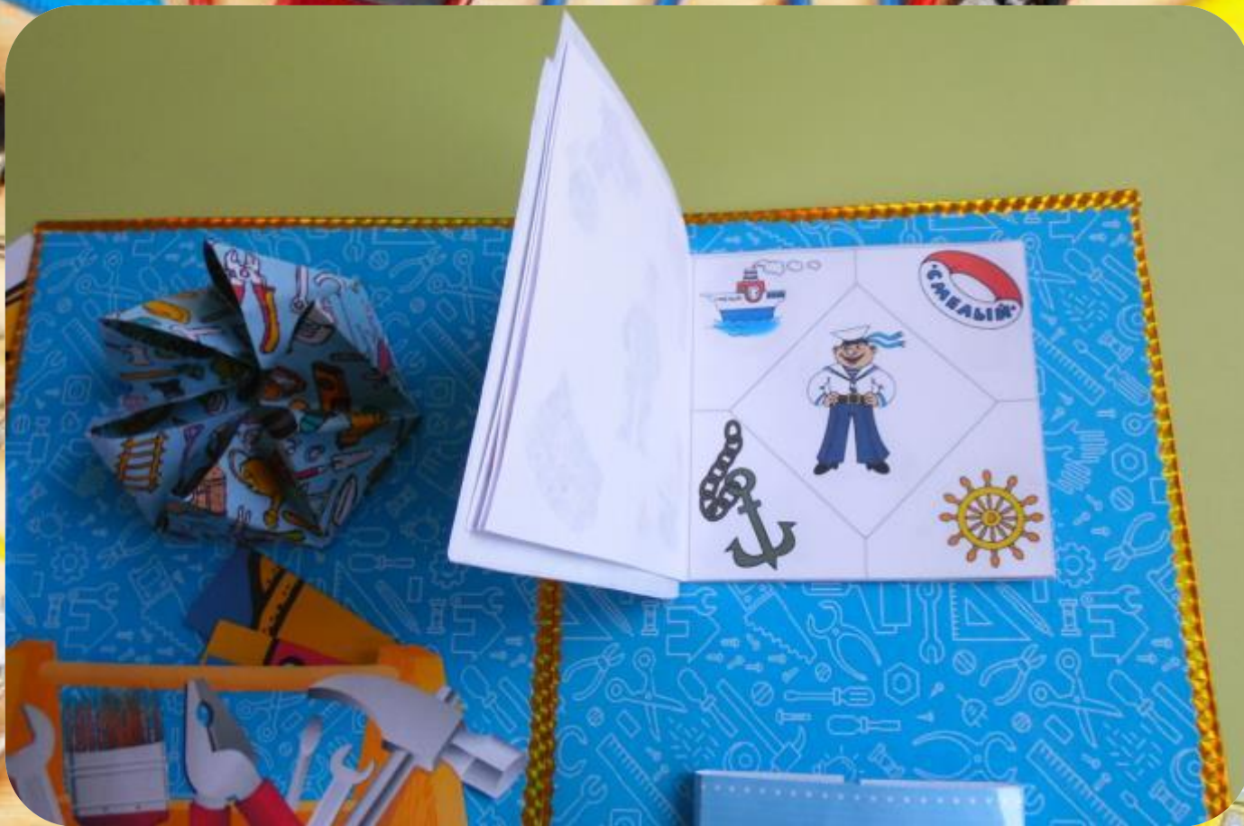
Книжка «Мужские профессии»