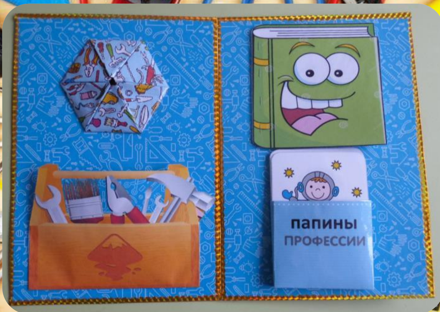
Первая и вторая страницы лэпбука