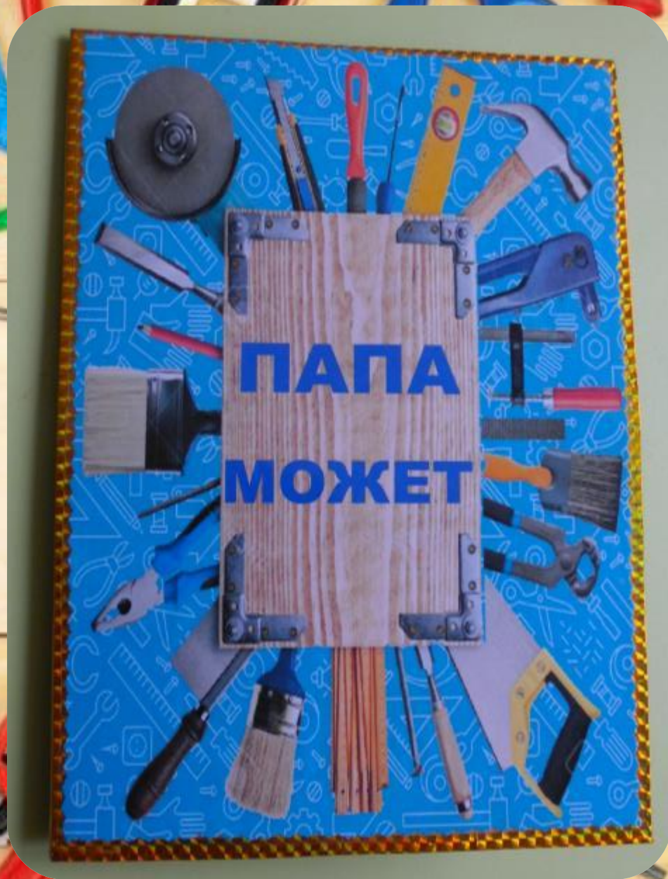
Титульная страница лэпбука