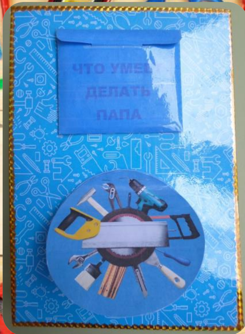
Обратная сторона лэпбука