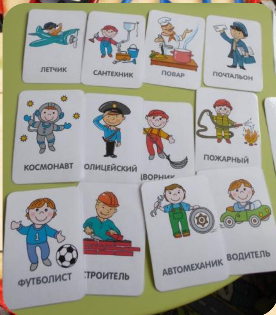
Карточки «Папины профессии»