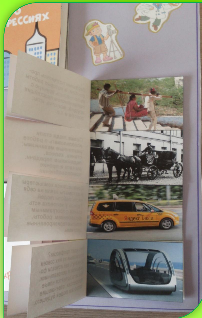
Стихи о профессиях, история профессий