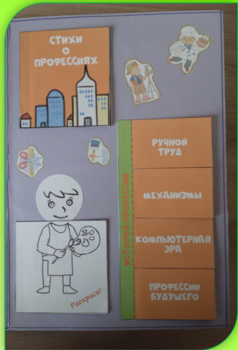
Диск-игра «Кто здесь работает?»