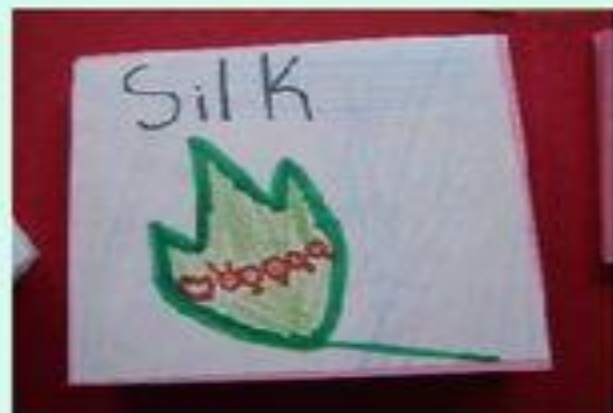
↑ Three Square Unfolding Book