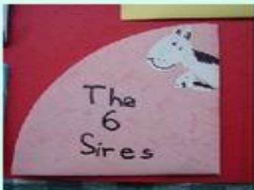
↓ Circle Book