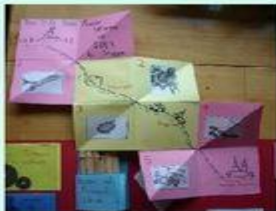
← Trifold Book