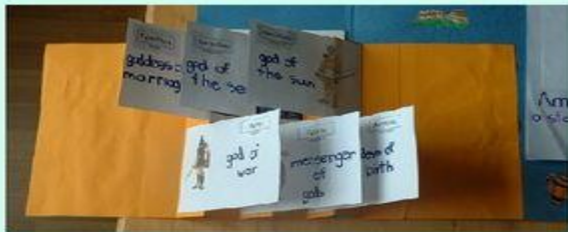
↑ Flag Book