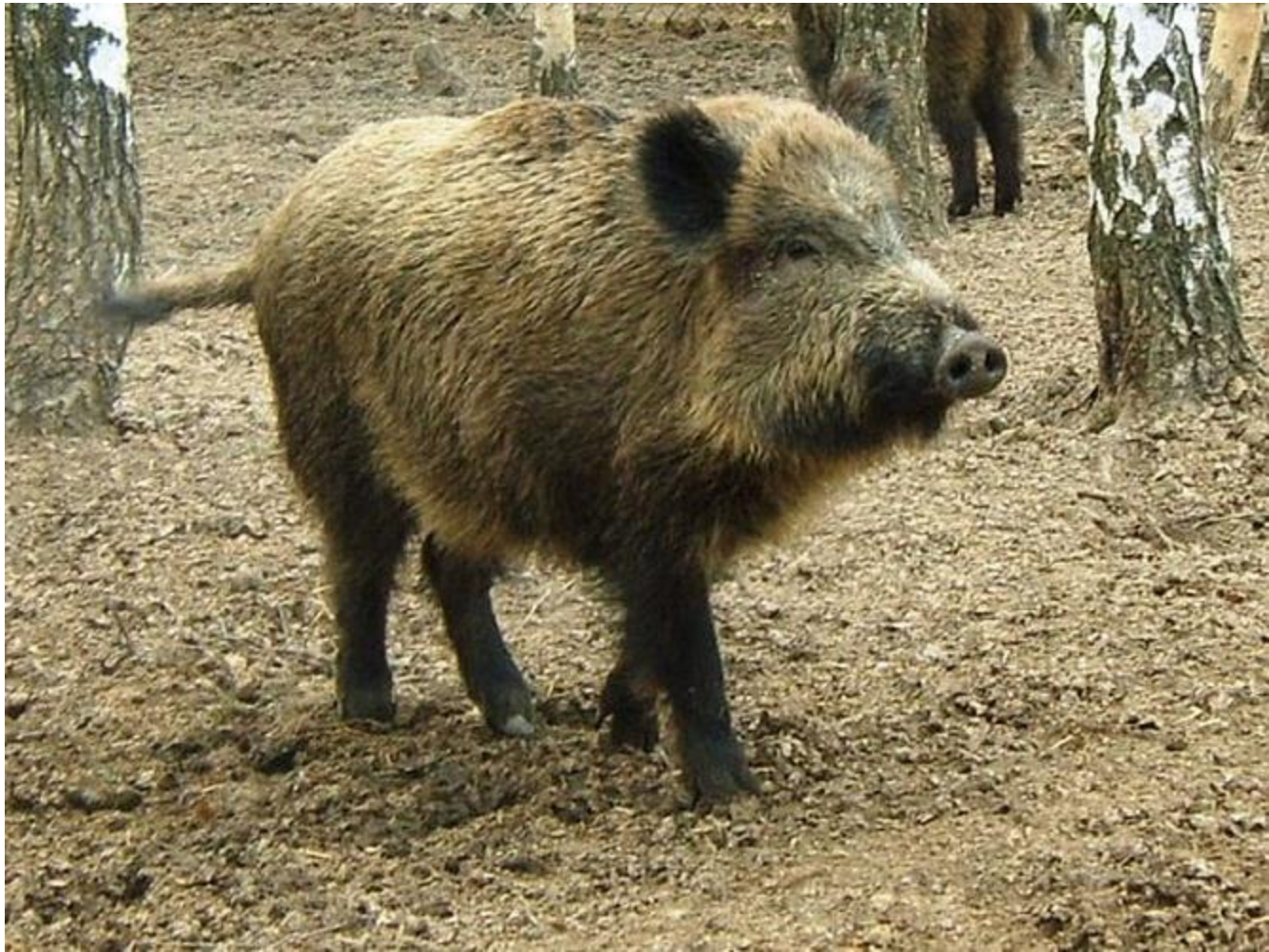
Кабан, а так же лисица, волк, ондатра, заяц-беляк