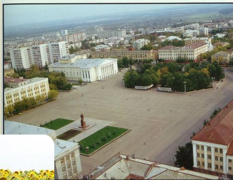
Театральная площадь.

ЗАЩИТА ЗЕМЕЛЬНЫХ УГОДИЙ, ПУТЕЙ ТРАНСПОРТА И НАСЕЛЕННЫХ ПУНКТОВ ОТ ВРЕДНОГО ВЛИЯНИЯ КЛИМАТИЧЕСКИХ И ГИДРОЛОГИЧЕСКИХ ФАКТОРОВ