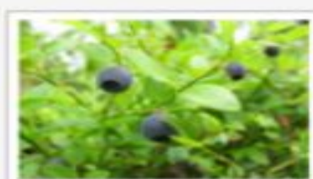
bilberries — черника [ˈbɪlb(ə)rɪ]