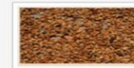
cocoa — какао [ˈkəʊkəʊ]