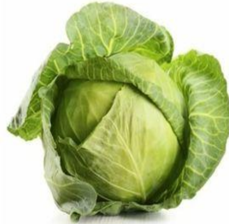
cabbage ['kæbɪdʒ] капуста