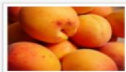
apricot — абрикос [ˈeɪprɪkɒt]