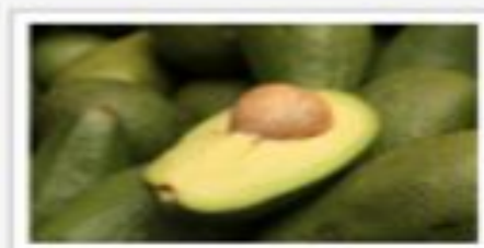
avocado — авокадо [ˌævəʊˈkjuːdəʊ]