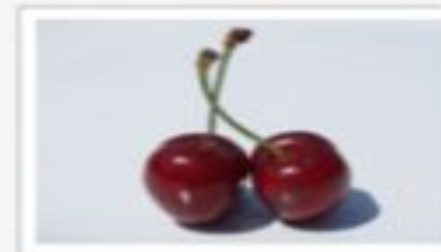
cherry — вишня [ˈtʃeri]