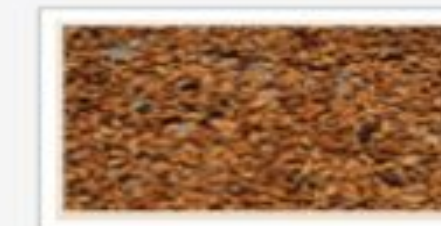
cocoa — какао [ˈkəʊkəʊ]