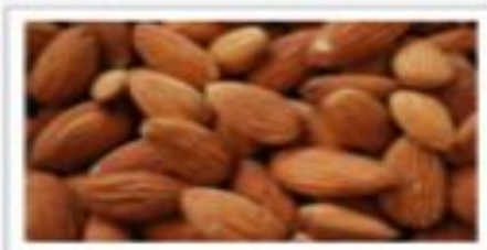
almond — миндаль [ˈɑːmənd]