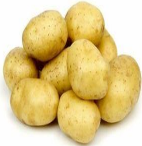
potato [pə'tetəu] картофель