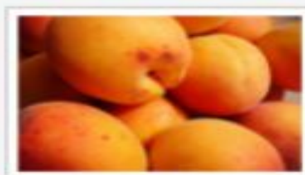
apricot — абрикос [ˈeɪprɪkɒt]