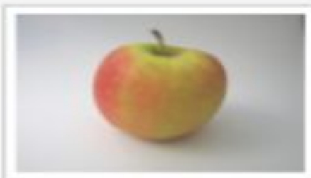
apple — яблоко [ˈæpl]