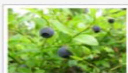
bilberries — черника [ˈbɪlb(ə)rɪ]