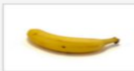
banana — банан [bəˈnɑːnə]