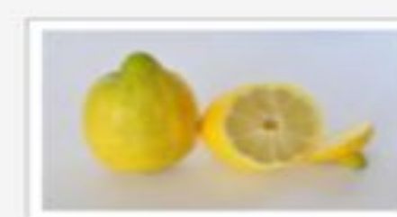
citron — цитрон [ˈsitren]