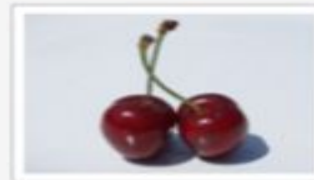
cherry — вишня [ˈtʃeri]