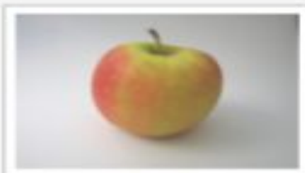
apple — яблоко [ˈæpl]