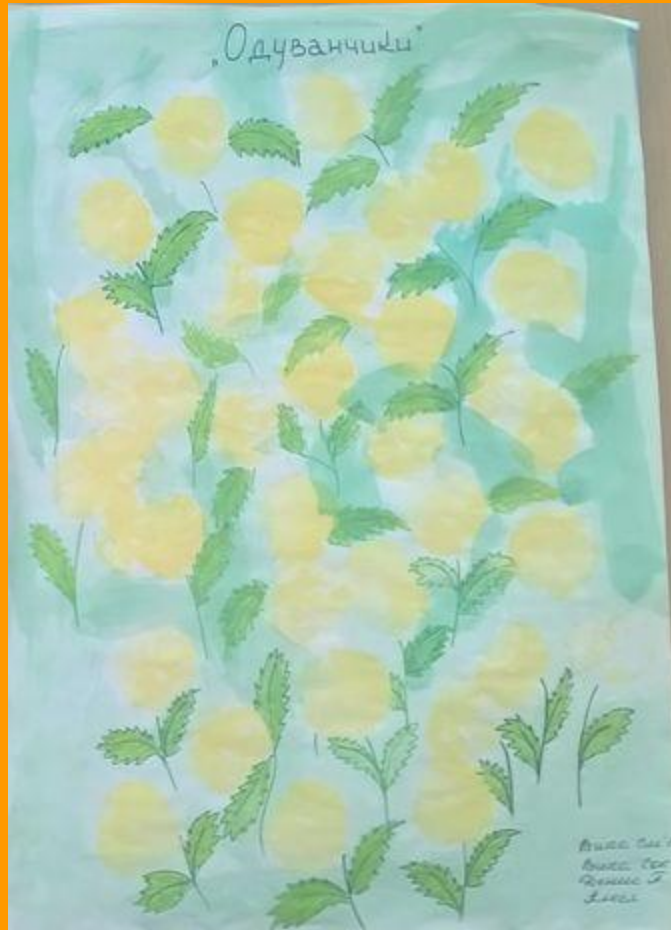
«Одуванчик» С. Пшеничных

Был я солнышком лучистым, Стал я облачком пушистым!