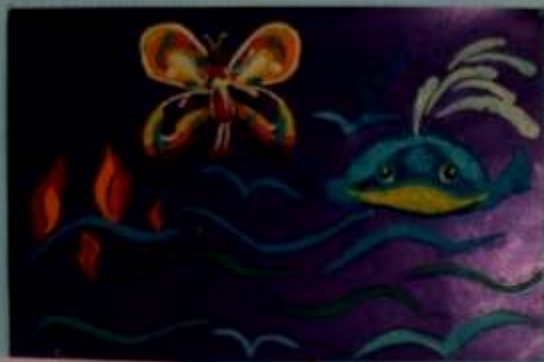
ПУТАНИЦА по сказке Чаровского КС