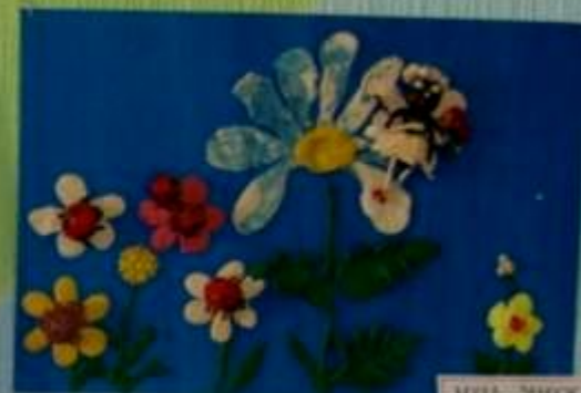
МУЖА ЗЕМУЖИ ИДЕТ по сказке Чаровского КС "Муж Царевича" Восница БИКА