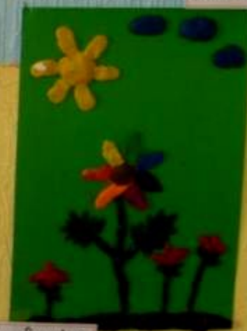
цветик - Семицветик по одноименной сказке КАЛЕЩНИКОВА ЛЕКА