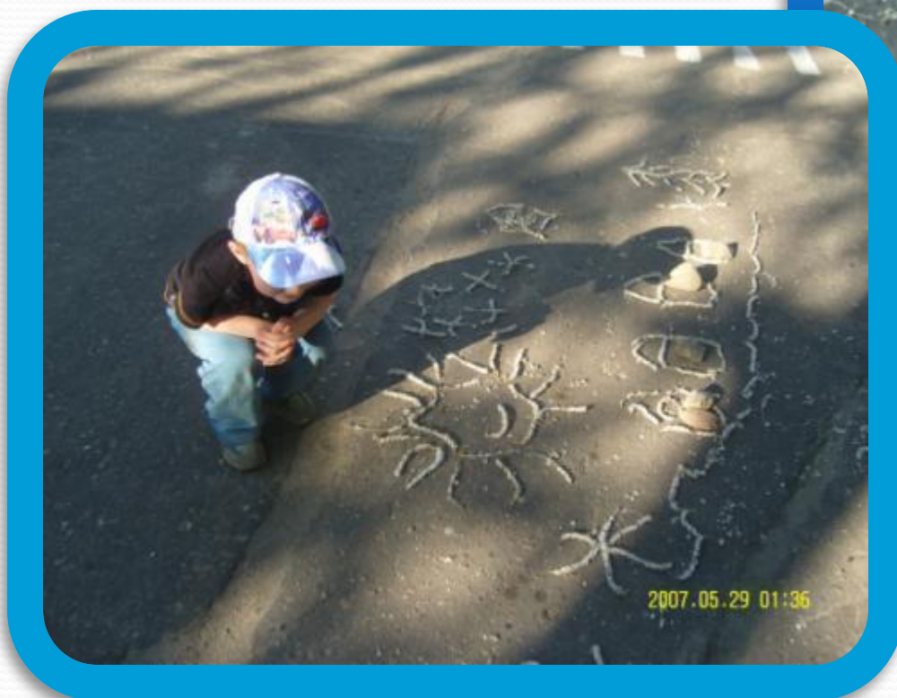
Рисунки из серёжек тополя и камней