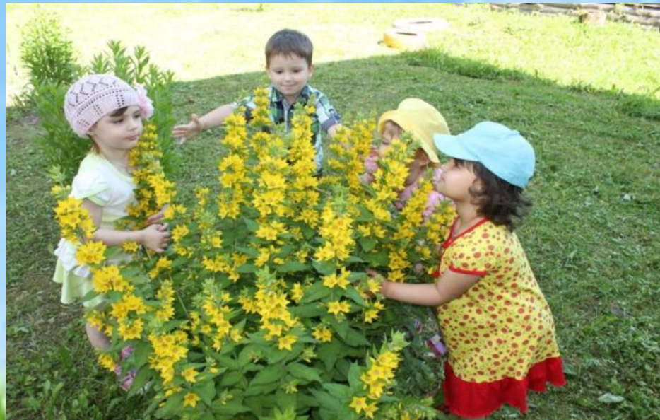
Ребята 1 мл. группы наслаждаются ароматом только распустившихся цветов!