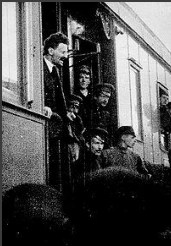
Лев Троцкий в 1917 году

Узнав о Февральской революции, Лев Троцкий направился на родину. В мае 1917 прибыл в Россию и занял позицию резкой критики Временного правительства. В июле вступил в составе «межрайонцев» в партию большевиков. Во всем блеске проявил свой талант оратора на заводах, в учебных заведениях, в театрах, на площадях, в цирках, по своему обыкновению плодовито выступал как публицист. После июльских дней был арестован и оказался в тюрьме.