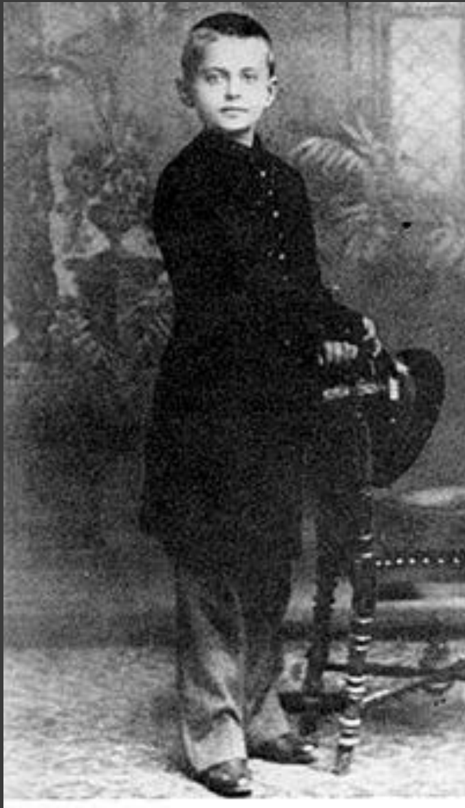
Лев Бронштейн в детстве. 1888