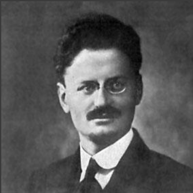
Лев Троцкий в период второй эмиграции