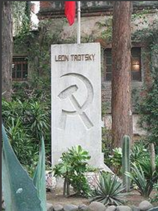
Могила Льва Троцкого.