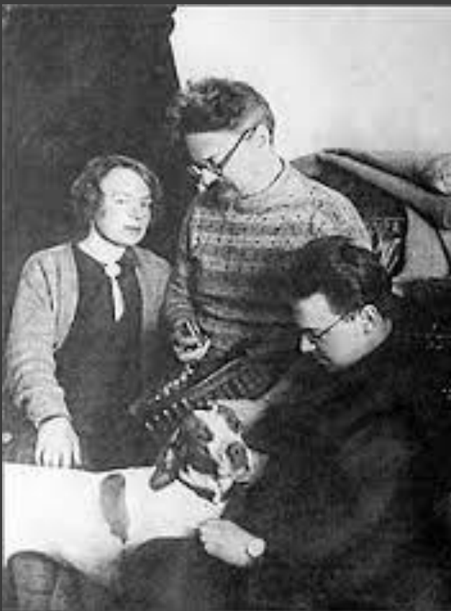
Л.Троцкий в ссылке в Иркутской губернии. 1900.