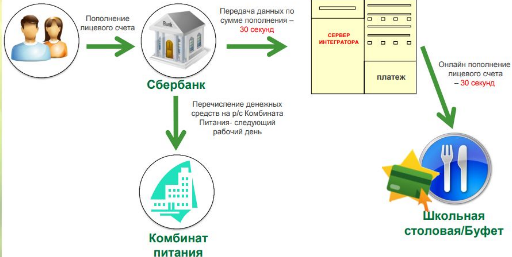
СХЕМА ПОПОЛНЕНИЯ И ОПЛАТЫ