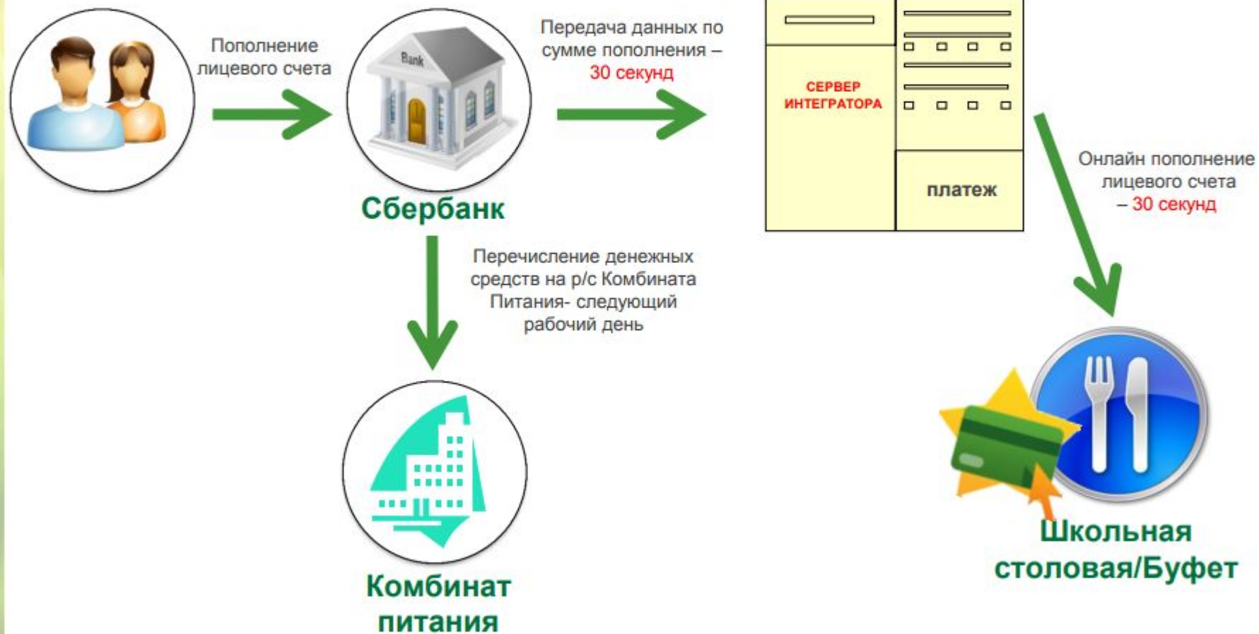
СХЕМА ПОПОЛНЕНИЯ И ОПЛАТЫ