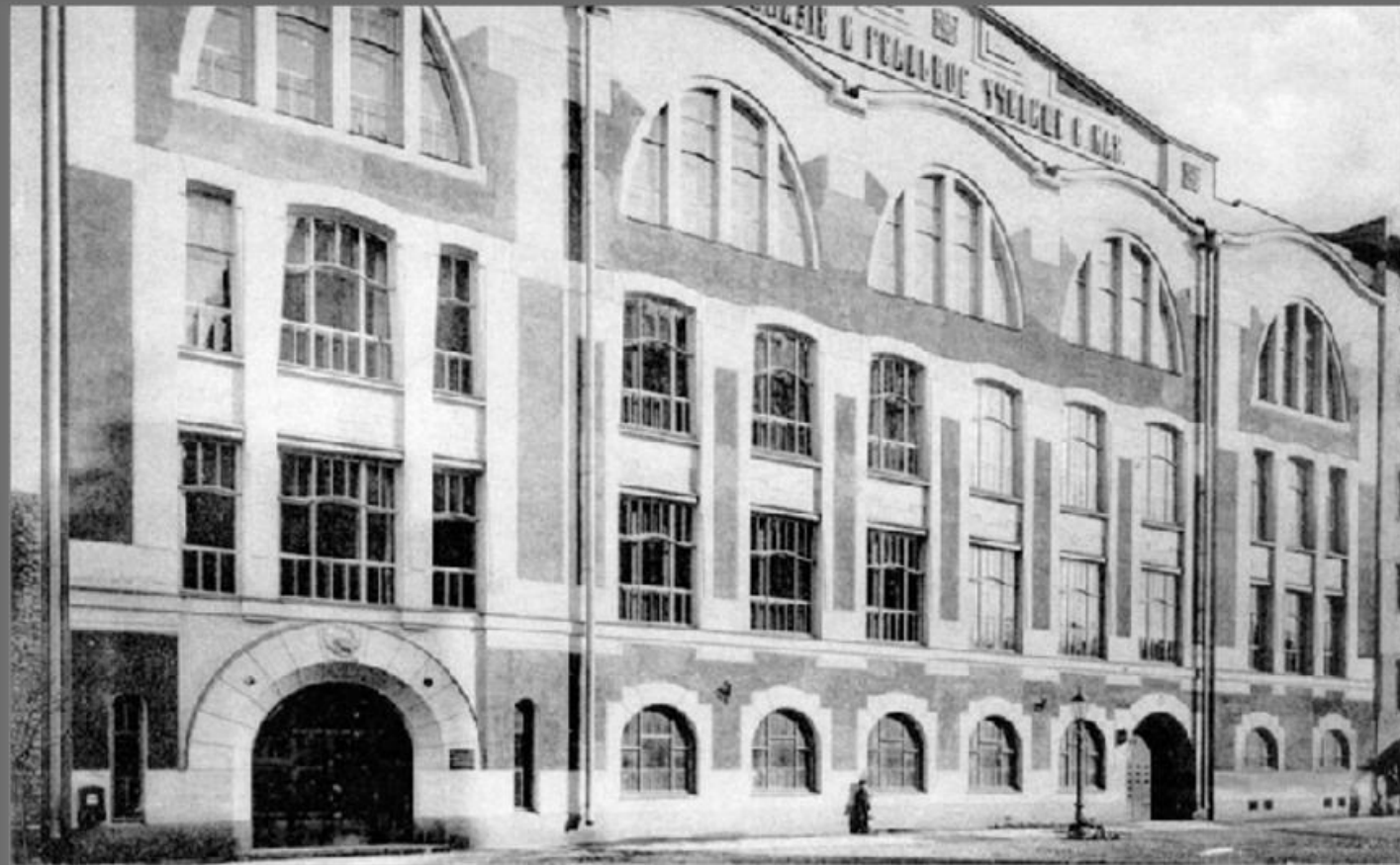
Гимназия К.И. Мая