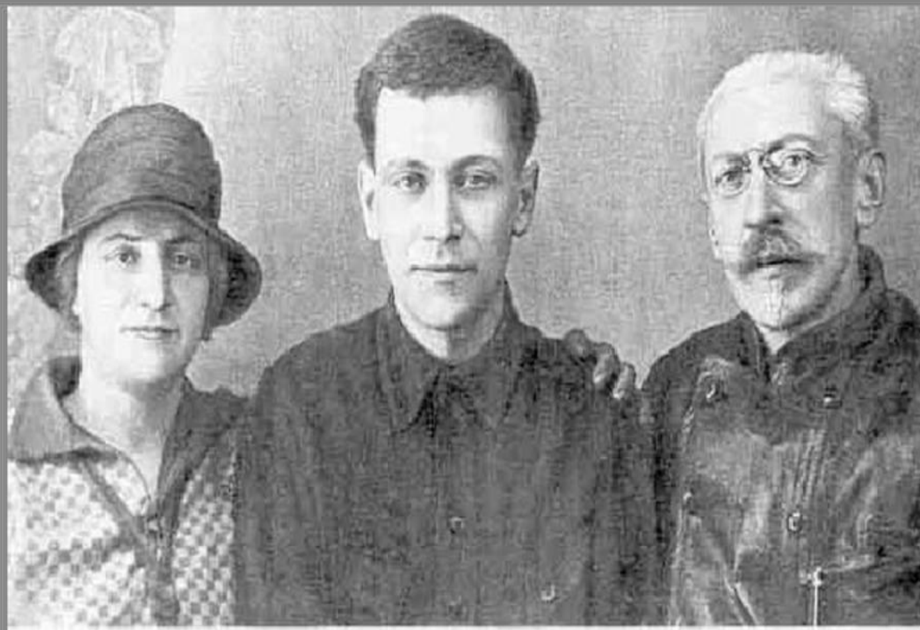
Дмитрий Лихачев с родителями 1929 г.