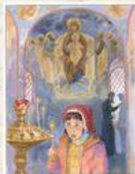
Рис. к рассказу «О самом главном»