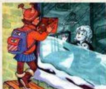
Рис. к рассказу «Анна, не грусти!»