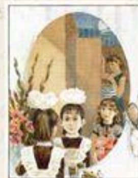
Рис. к рассказу «Сокровище»