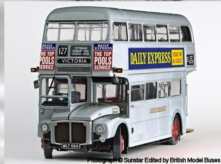
Photograph © Sunstar Edited by British Model Buses

Изначально автобусы были красного цвета. Сейчас они и не только красного, но и зелёного, золотого и серебряного.