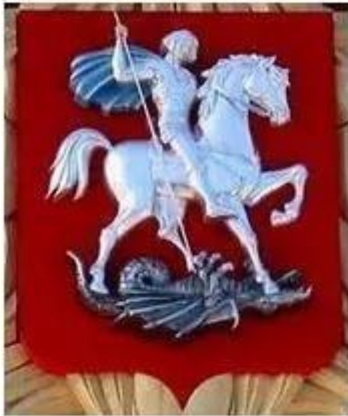
Щит на гербе России