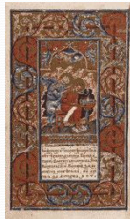
Мініатюра "Євангеліст Йоан з Прохором"