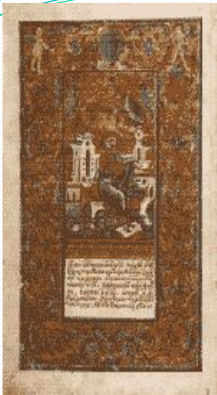
Мініатюра "Євангеліст Матвій"