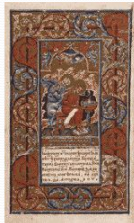
Мініатюра "Євангеліст Йоан з Прохором"