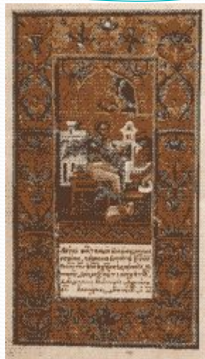
Мініатюра "Євангеліст Лука"