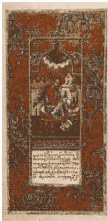
Мініатюра "Євангеліст Марко" Лука"