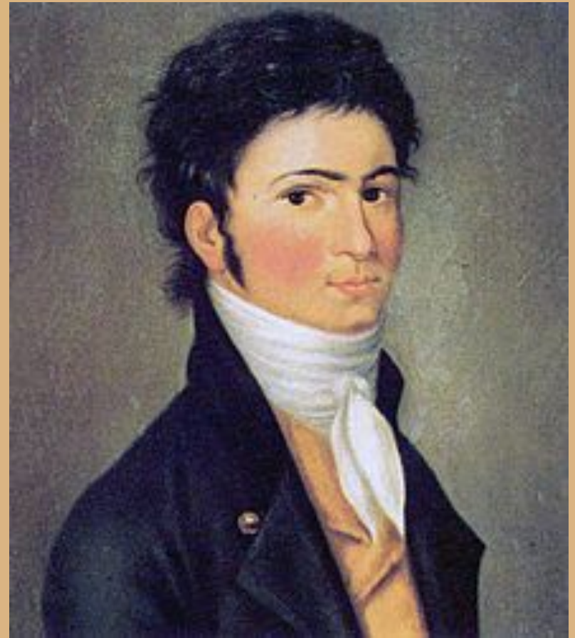
Beethoven im Alter von 30

Beethoven begann Komponieren in seiner Kindheit. Sein erster Lehrer war mein Großvater. Der zweite - der Vater. Ankunft in Wien, begann Beethoven seine Studien bei Haydn, sondern wurde schnell desillusioniert Klassen und Schüler und Lehrer. Gaidai erschreckt seine dunklen Melodien und kühnen Blick auf die Welt