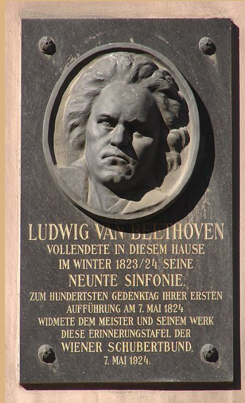
Eine Gedenktafel in Wien