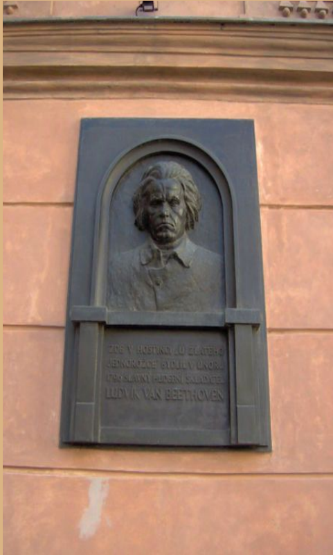
Gedenktafel in Prag