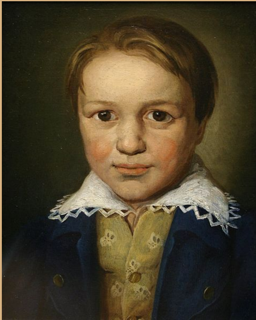
Portrait von Beethoven im Alter von 13 Jahren