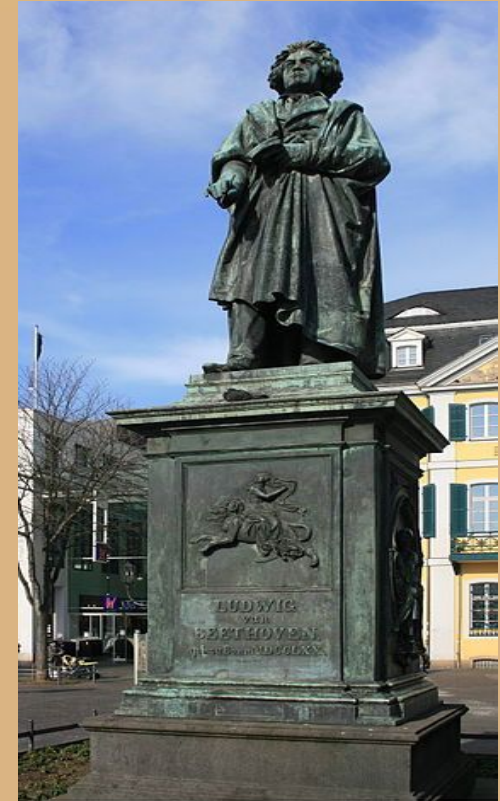
Monument in Bonn