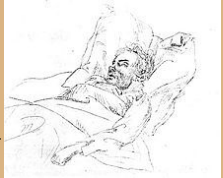
Beethoven auf dem Sterbebett