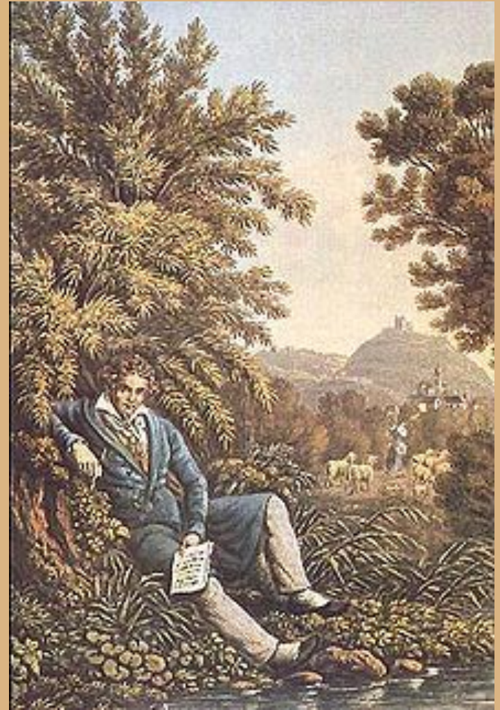
Beethovens Sechste Symphonie komponiert

Nach 1812 des Komponisten schöpferische Tätigkeit zu dem Zeitpunkt, zu fallen. Doch drei Jahre später begann er mit der gleichen Energie. Beethovens Popularität wuchs mehr und mehr. Auch wenn er taub war, hatte er Zeit, um die neuesten Nachrichten zu kennen und verfolgen eine musikalische Karriere.