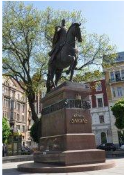
Пам'ятник Данилу Галицькому