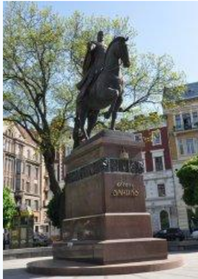
Пам'ятник Данилу Галицькому