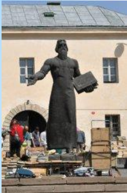
Пам'ятник Івану Федорову