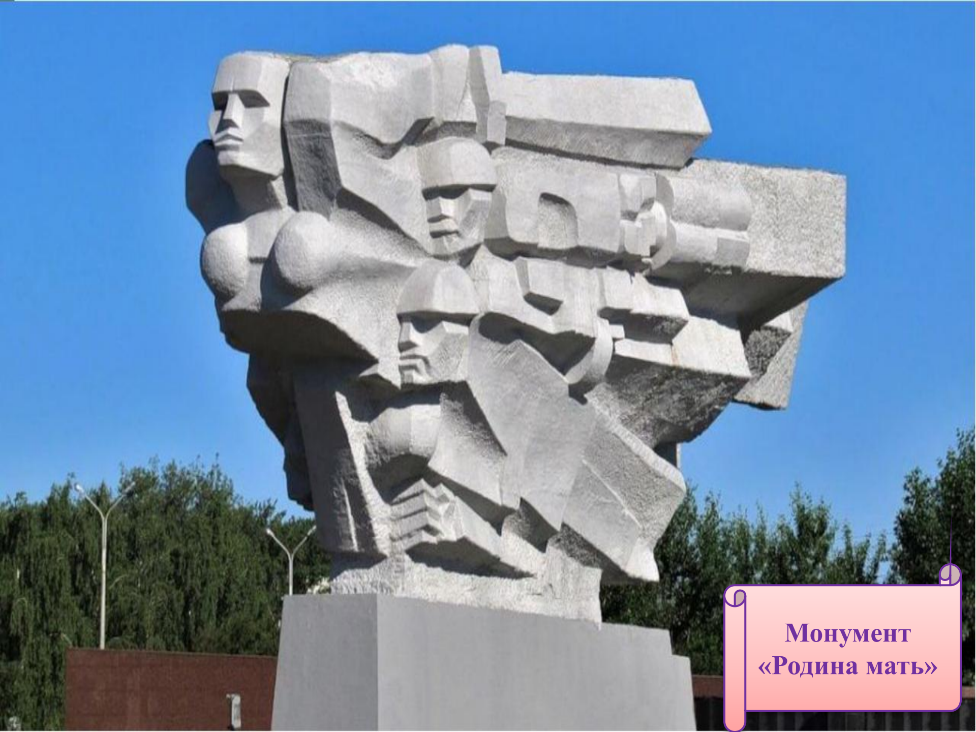
Монумент «Родина мать»