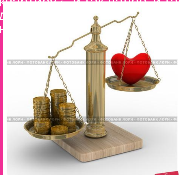
Любовь по расчету