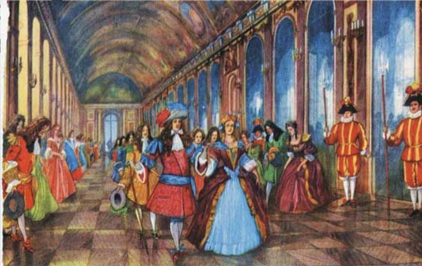
Людовик XIV и придворные в Зеркальной галерее Версальского дворца