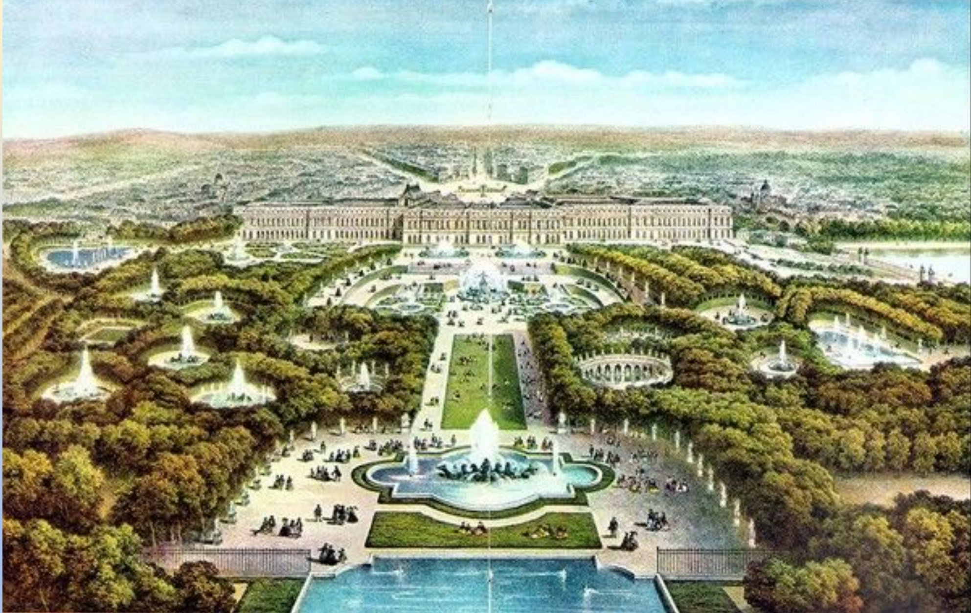
Резиденция короля – Версаль ( 24 км. от Парижа)