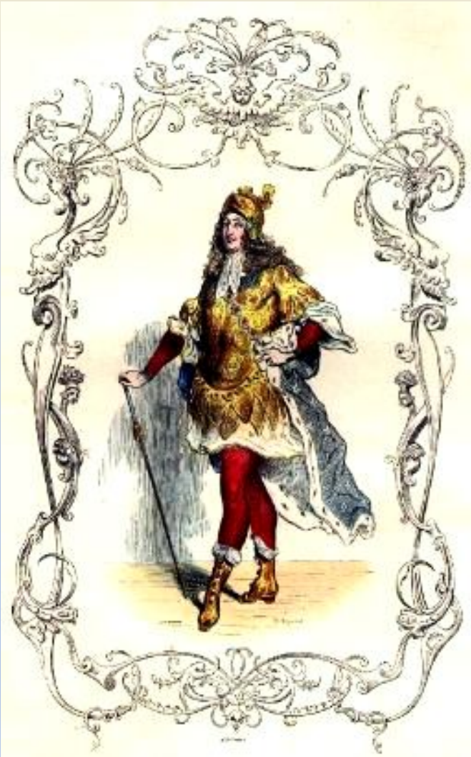
Людовик XIV. Гравюра

Французский двор вращался вокруг блистательного монарха. Стремился привлечь аристократию синекурами – необременительными, но высокооплачиваемыми должностями. Людовик создал новый образ французской монархии.