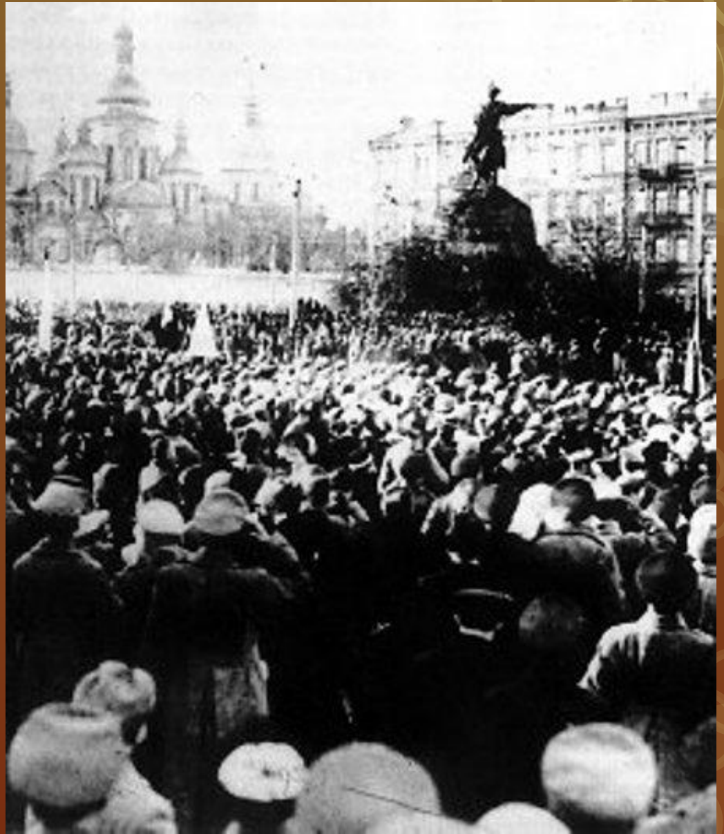
Віче на Софійській площі в Києві 19 березня 1917 року

3—5 (16—18) березня на території України практично були ліквідовані органи царської адміністрації, виконавча влада перейшла до призначених Тимчасовим урядом губернських та повітових комісарів. Як і в Росії, в Україні почали формуватися Ради об'єднаних організацій, а також Ради робітничих і солдатських депутатів.