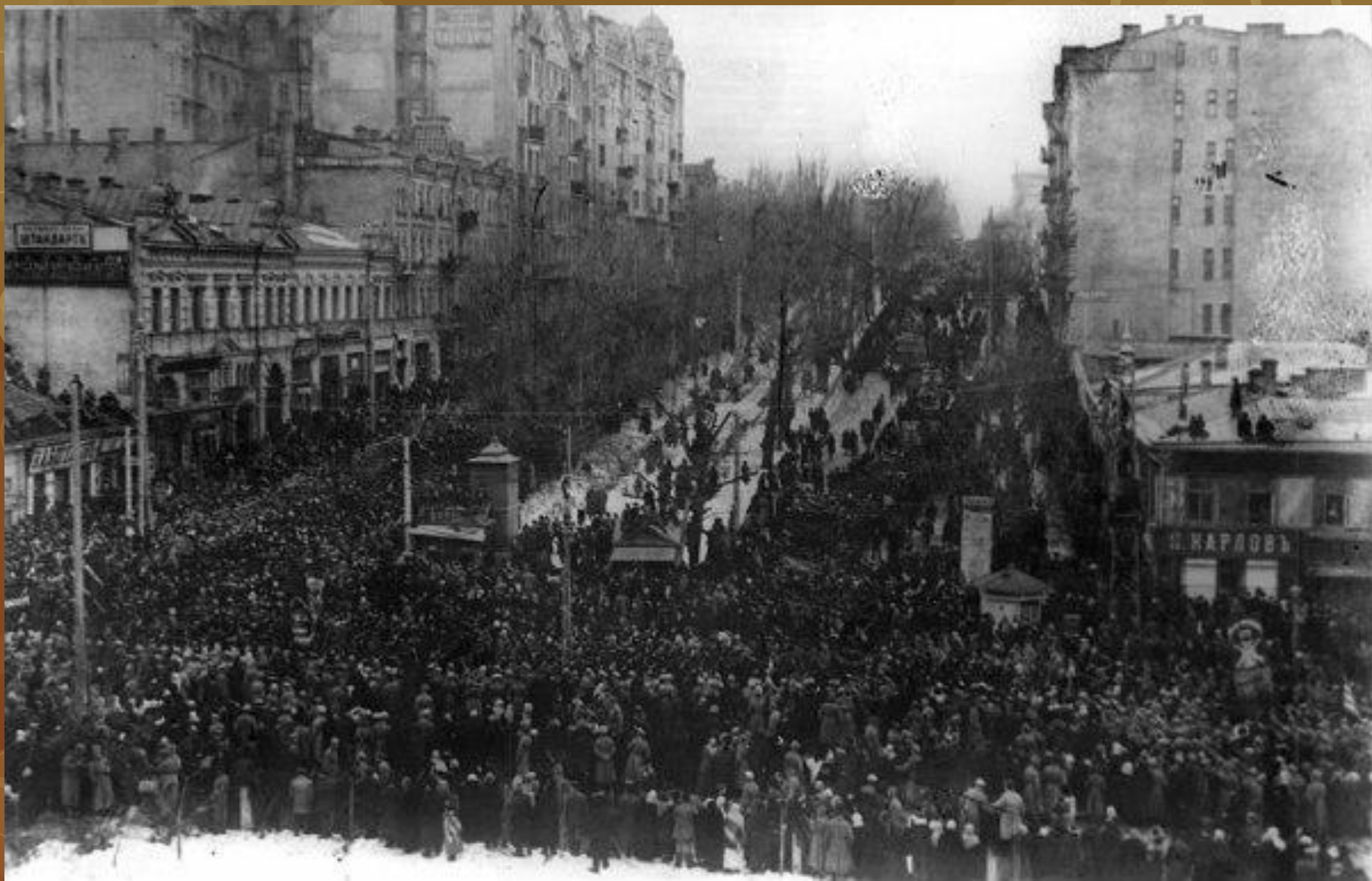
Березень 1917 року. Маніфестація на розі Хрещатика і нинішнього бульвару Шевченка .В ці дні в Києві постала Центральна Рада