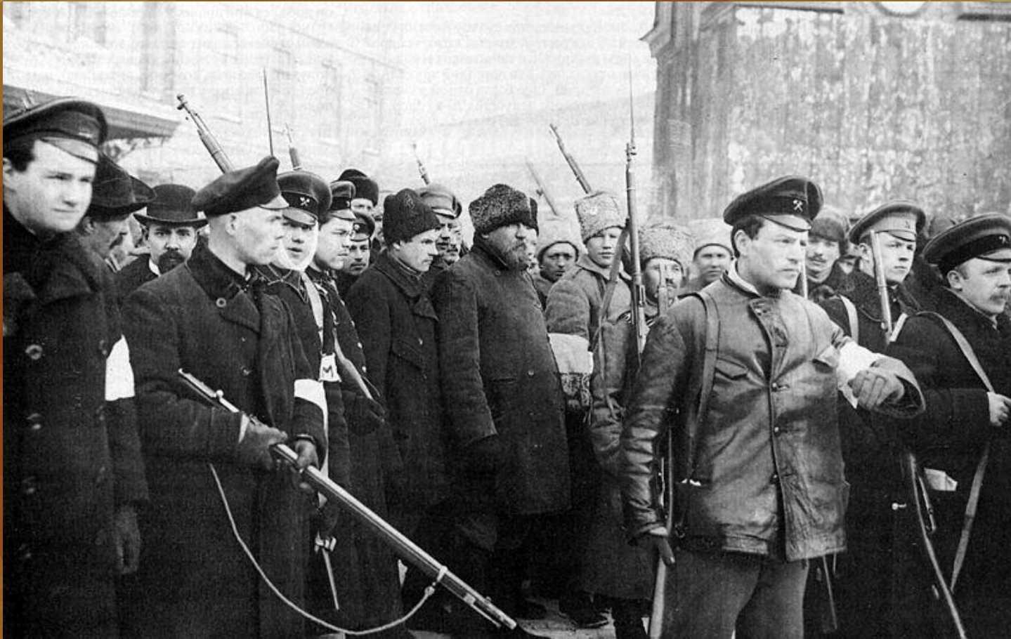
Арешт переодягнених городових. Петроград. Лютий 1917 року

Лютне́ва револю́ція 1917 ро́ку в Росі́ї — революці́йні події лютого-березня 1917 року, що завершилися падінням монархії у Російській імперії.