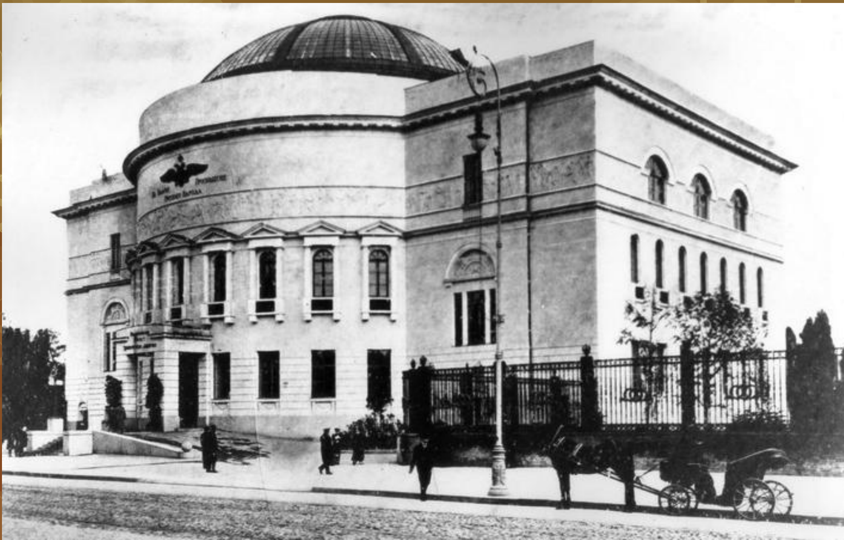
Педагогічний музей імені цесаревича Олексія 1909–1911 роки, де працювала Українська Центральна Рада. Фотографія 1911 року