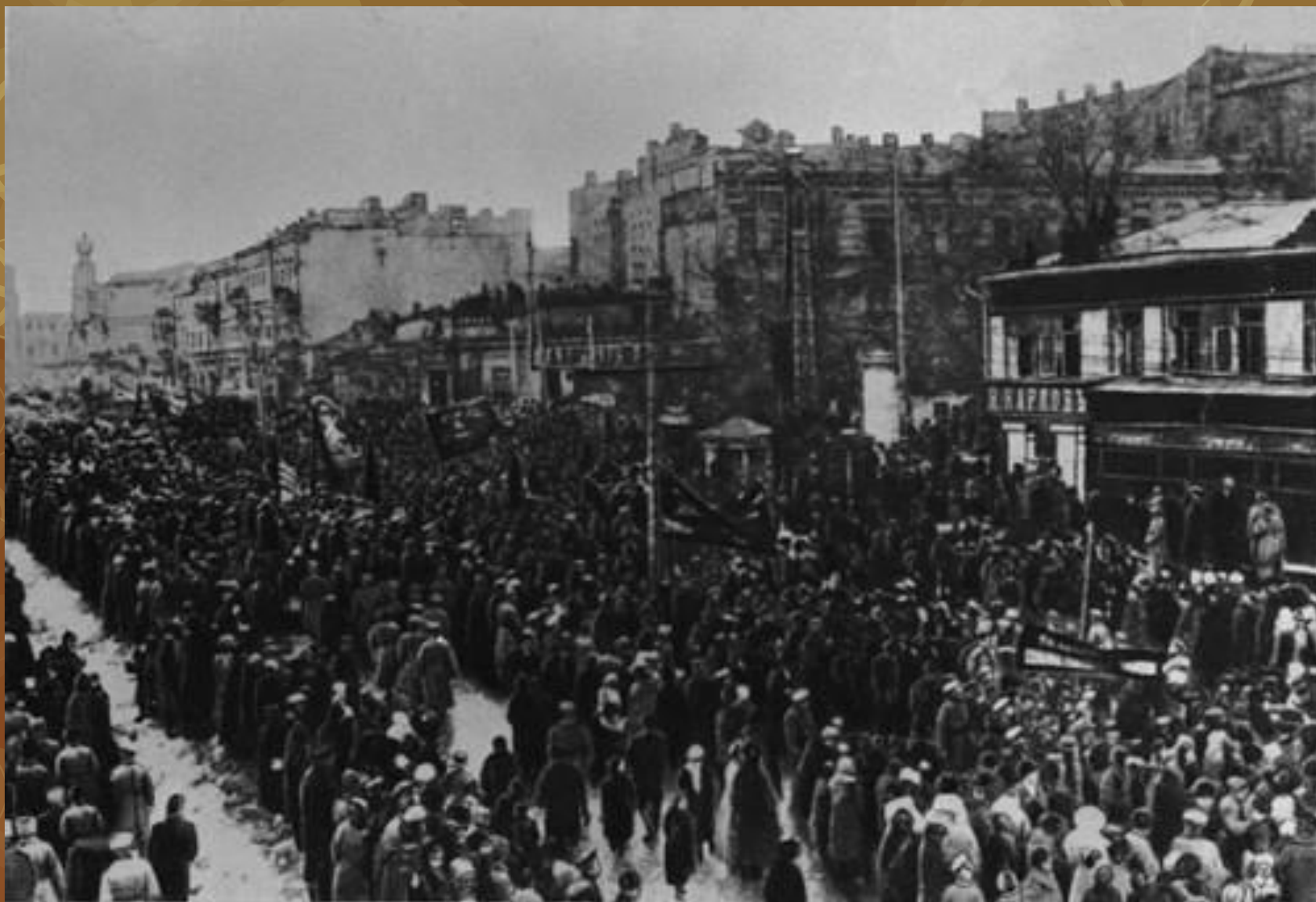
Маніфестація на Великій Васильєвській вулиці (нині Червоноармійська) березень 1917р. Київ