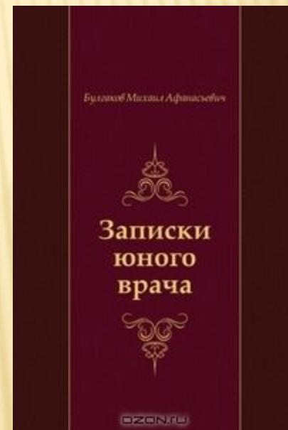
Иллюстрация и обложка к рассказам цикла.