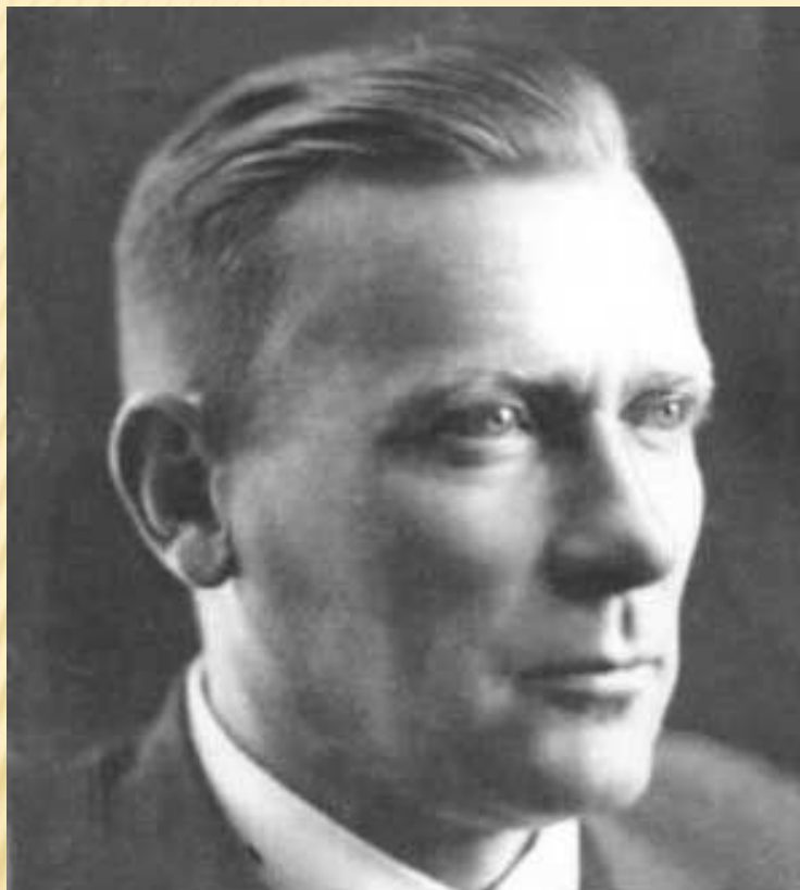
М. А. Булгаков