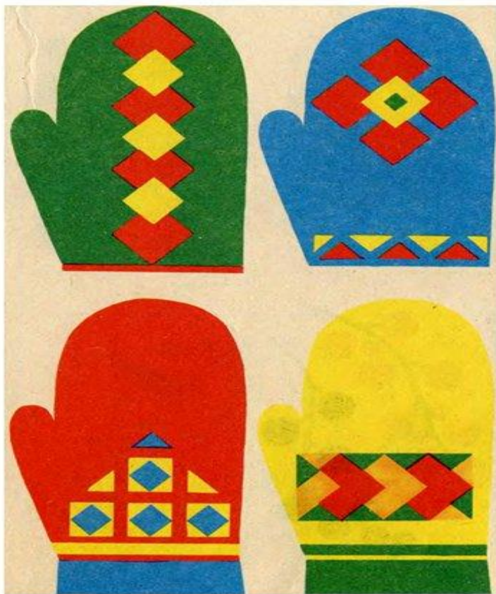
Рис. 39. Варианты украшения рукавиц геометрическими орнаментами