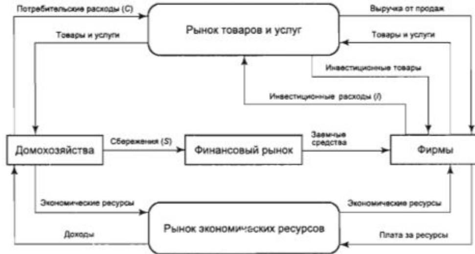
Рис. 1.2. Кругооборот продукта, расходов и доходов в двухсекторной модели экономики с финансовым рынком