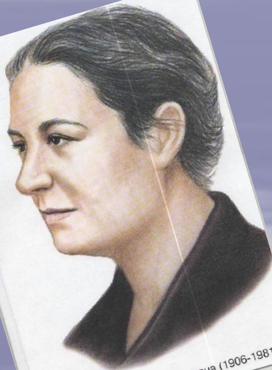
Барто Агния Львовна (1906-1981)

Полина Виардо (по мужу Тургенева) обладала великолепным голосом и большим сценическим талантом. Она завоевала себе выдающееся положение на оперных сценах (Париж, Лондон, Петербург).