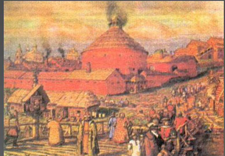
Пушечный двор Худ. А. Васнецов. 1818 г.