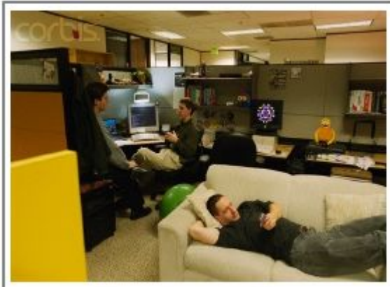
в офисе Google